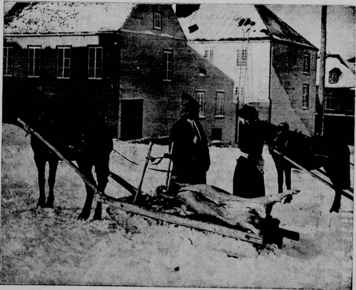
LA PREMIÈRE NEIGE A QUÉBEC A TRAVERS LE CANADA