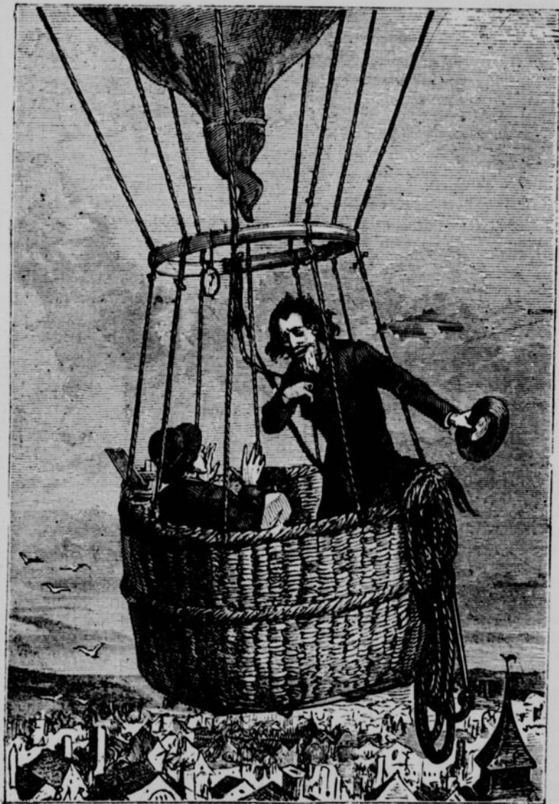
« Monsieur, je vous salue bien ! » me dit-il.— Voir page 293, col. 3.

—Je connais votre habileté, répondit posément l'inconnu, et vos belles ascensions ont fait du bruit. Mais si l'expérience est sœur de la pratique, elle est quelque peu cousine de la théorie, et j'ai fait de longues études sur l'art aérostatique. Cela m'a porté au cerveau !—ajouta-t-il tristement, en tombant dans une muette contemplation. Le ballon, après