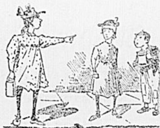
TOUT EST RELATIF

—Ce serait de bien vouloir retirer le beau manteau de loutre qui se trouve dans votre vitrine, car dans quelques instants je vais passer par ici avec ma femme.