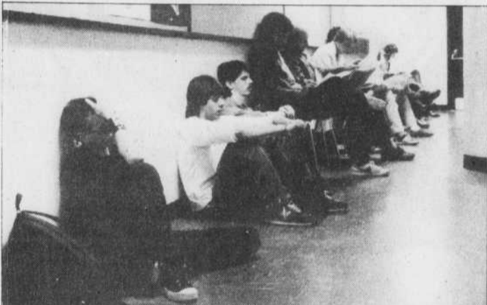
Le directeur de la polyvalente Calixa-Lavallée refuse d'interpréter l'incident comme un signe de la montée du racisme dans les écoles.