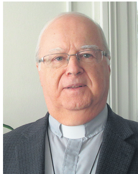
Mgr Jean Gagnon, évêque du diocèse de Gaspé.

L'idée d'acheminer le montant de la dîme à même la facture du compte de taxes acheminé par la municipalité a aussi été évoquée.