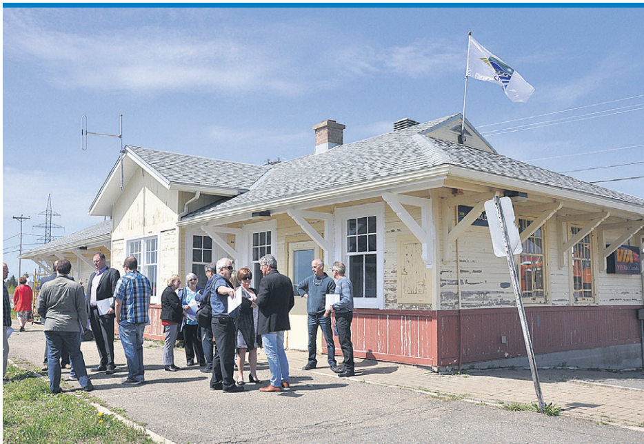
L'ancienne gare de Chandler devient le premier endroit où les visiteurs pourront acheter des billets avant d'être transportés vers le parcours nocturne.