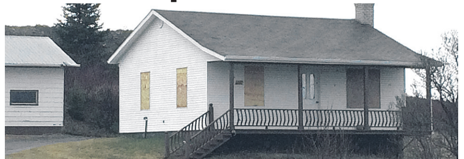
Une résidence placardée tout près de la mine qui sera en exploitation d'ici la fin de l'année.

À ce sujet, elle affirme que « les résidences qu'on a besoin d'acheter en raison des opérations de la carrière, nous les avons. Ce qui se discute actuellement avec les résidents qui se sont plaints il y a quelques mois, c'est vraiment autre chose. Ce n'est pas nécessairement de l'acquisition. C'est une autre dynamique que nous sommes en train de discuter avec ces gens-là. »