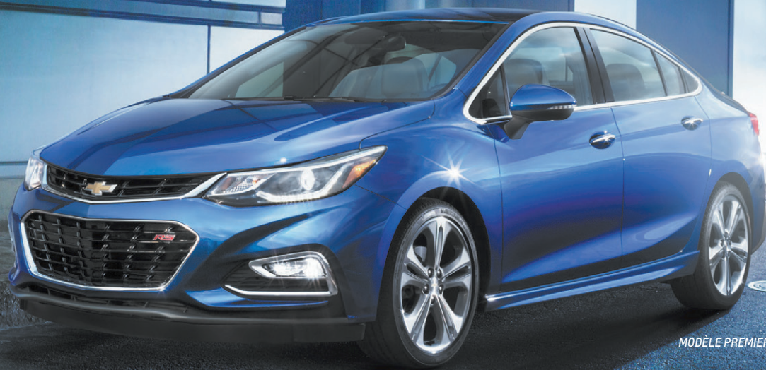
MODÈLE PREMIER RS ILLUSTRÉ

1000 PAIRES DE BILLETS À GAGNER POUR UNE SOIRÉE EXCLUSIVE