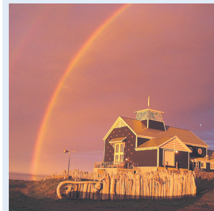
Plusieurs productions locales seront également au menu.

Plusieurs productions locales seront également au menu. Que ce soit « Le Grand Jour », une pièce de théâtre montée par les élèves de l'École du P'tit-Bonheur de Grande-Vallée, « La Déprime », comédie québécoise avec les comédiens de la troupe de la Vieille Forge, ou encore les soirées avec la Petite Ligue d'improvisation de l'Estran, il y en aura pour tous les goûts. Aucune excuse pour ne pas se rendre à Petite-Vallée cet été. À noter que les billets pour tous les spectacles de la saison estivale sont en vente à la billetterie du Théâtre de la Vieille Forge ou sur le site web du réseau Admission.