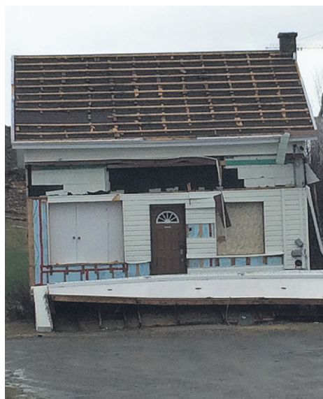
En voici une autre qui sans doute devra être démolie au cours des prochaines semaines.

Je recherche un appartement 2 1/2 semi meublé, libre immédiatement.