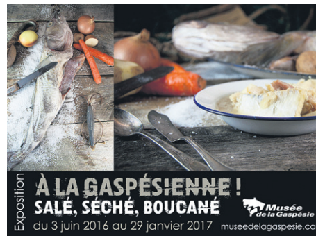
L'exposition À la gaspésienne! Salé, séché, boucané! sera présentée à partir de vendredi et le vernissage se tiendra le jeudi 9 juin.

alimentaire de la Gaspésie, plusieurs techniques de cuisine ancestrales ainsi que de nombreuses recettes d'époque s'inspirant de la mer, de la rivière et de la forêt.