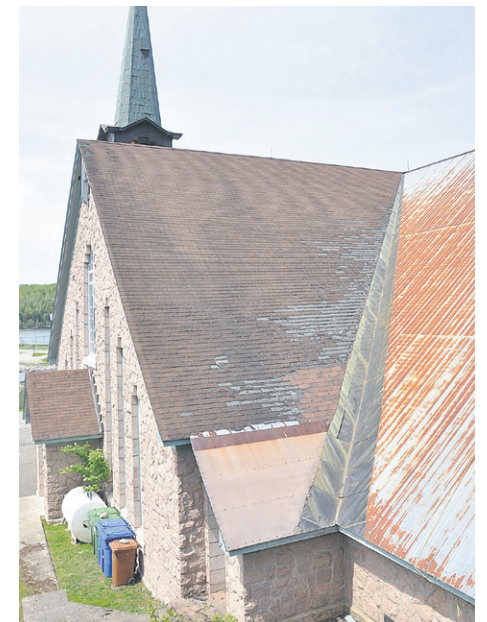
Un comité de financement verra à recueillir de l'argent pour venir en aide à la Fabrique de la paroisse. Voici un petit aperçu de l'état du toit sud de l'église de Port-Daniel.

Le président s'attend à beaucoup du comité de financement pour l'église de Port-Daniel. « J'ai