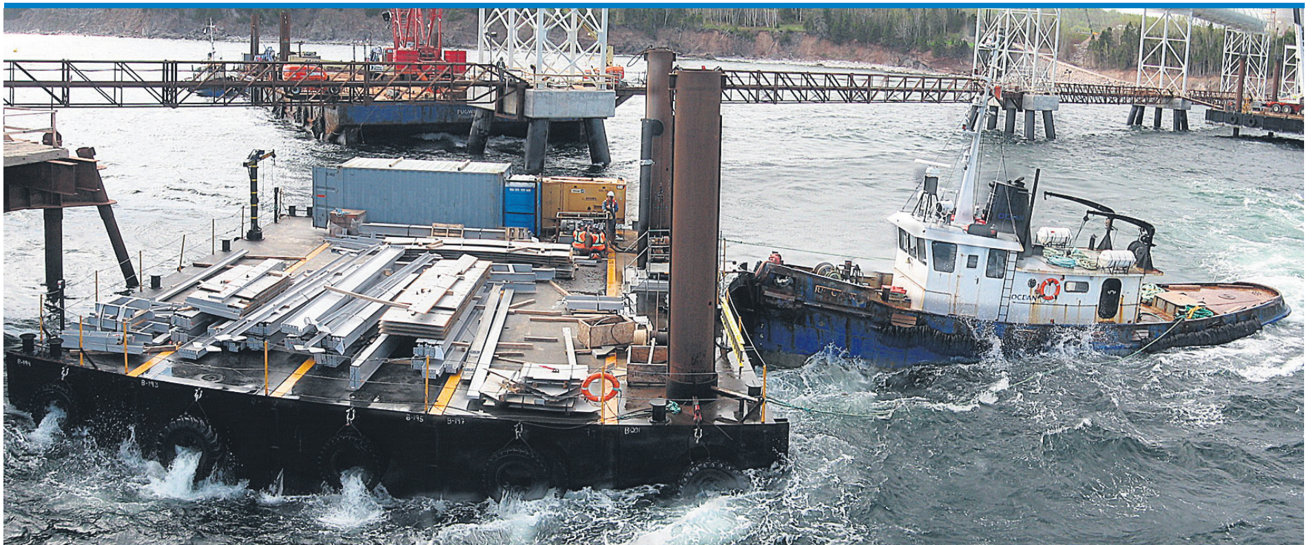
Les installations portuaires à la cimenterie recevront au cours des prochains mois du combustible et des additifs.