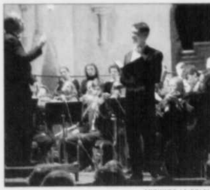
Les Violons du Roy

Avec 11 enregistrements à son actif et plusieurs prix prestigieux dont deux Juno, l'ensemble a autant de succès auprès de la critique que du public. Ensemble a donné plus d'une centaine de concerts depuis 1988, en