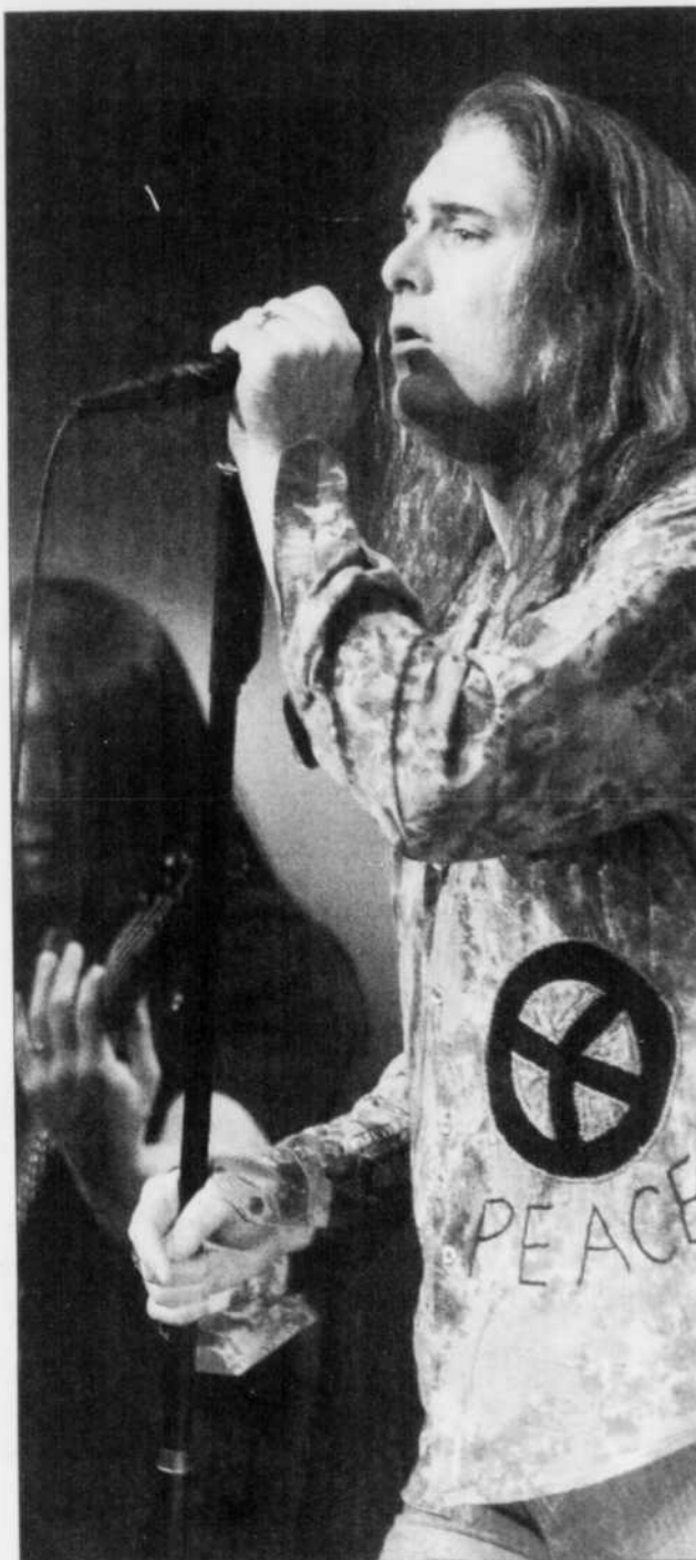
La machine du rock a présenté un show cohérent.

Une soirée que le groupe a conclue en beauté avec, en guise de rappel, une réjouissante version d' A Change Of Seasons . Une belle façon pour ces (incroyables!) musiciens de tirer leur révérence. Après pareil concert, il ne serait guère surprenant que le quintette nous rende de nouveau (et bientôt!) visite en tant que tête d'affiche.