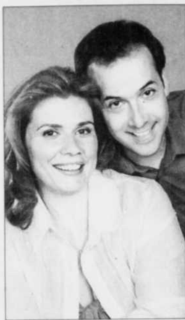
Marina Orsini et Pierre Brassard dans « Cauchemar d'amour », le jeudi, 20h, au Réseau TVA