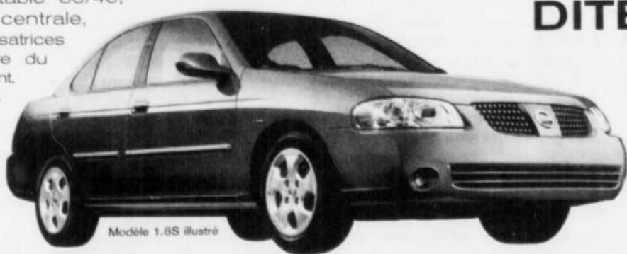
Modèle 1.8S illustré

une autre voiture de qualité japonaise à 199 $/mois † avec un comptant de seulement 995 $ , un dépôt de sécurité †† de 0 $ , transport et préparation compris en location, ou un financement à l'achat de 2,8 % * sans aucun paiement pendant 90 jours ** , et comprenant climatiseur , jantes de 15 po, radio am/fm/cd 100 watts à 4 haut-parleurs, siège du conducteur à 8 réglages , moteur 1,8 litres 126 chevaux, programme pour les diplômés, assistance routière 24 h, plein d'essence, coussins gonflables avant, essuie-glaces à balayage intermittent, chauffe-bloc, suspension arrière multibras différentielle, dossier de banquette rabattable 60/40, accoudoir sur console centrale, montre numérique, barres stabilisatrices (avant et arrière), téléouverture du coffre et de la trappe de carburant, carquette, freins avant à disque ventilé, témoins de niveau bas de liquide lave-glace, sécurité-enfants sur les serrures arrière, pare-choc couleur carrosserie et PLUS ENCORE!