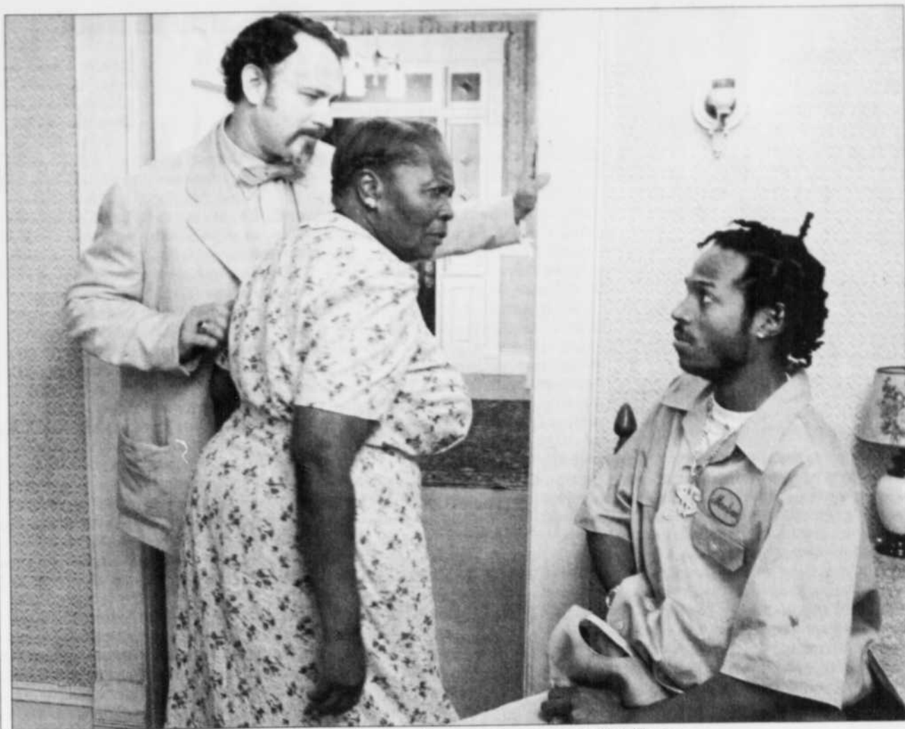
Une scène du film « Les Tueurs de dames », avec Tom Hanks