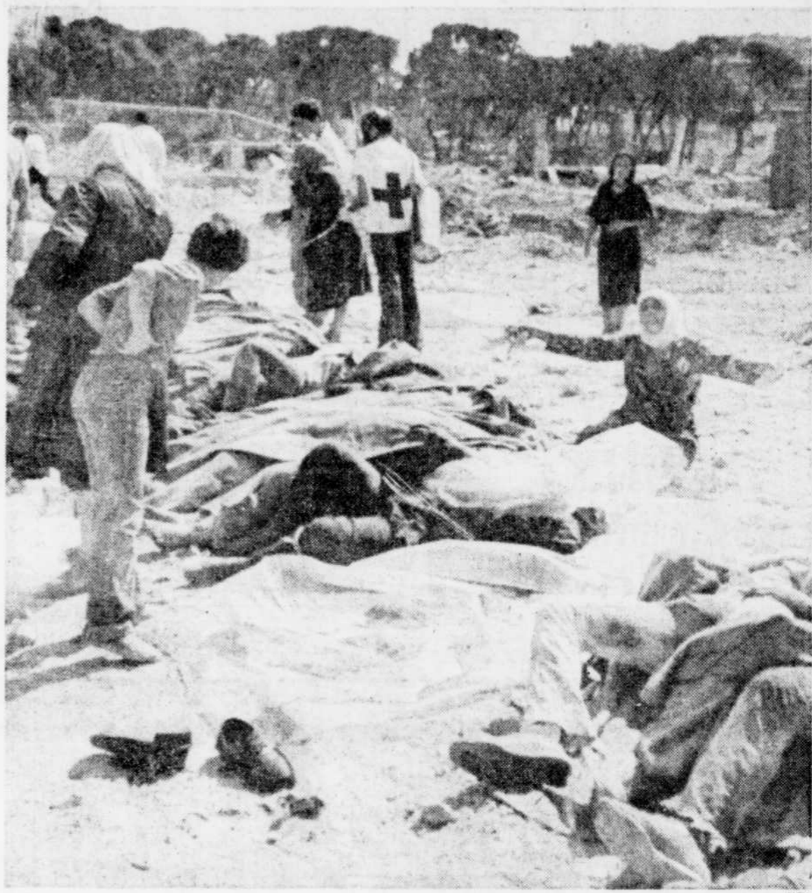
Cette Palestinienne pleure sur les corps de ses proches massacrés la semaine dernière dans le camp de réfugiés de Sabra, à Beyrouth-Ouest.

Le 9 avril 1948, rappelle-t-on, 254 personnes avaient été tuées dans le village de Deir Yassine, sur la route de Jérusalem, par les combattants juifs de l'Irgoun, dirigé alors par le premier ministre actuel d'Israël Menahem Begin. Le "groupe Stern", qui avait participé aussi au massacre, comptait parmi ses chefs l'actuel ministre israélien des Affaires étrangères, M. Yitzhak Shamir.