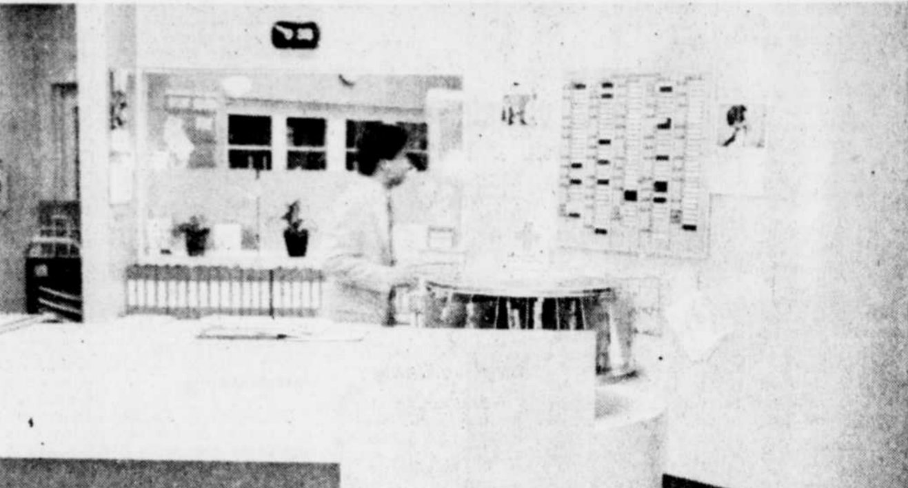
Le fichier des patients et les dossiers du poste de garde sont scrupuleusement authentiques et tenus comme dans un véritable hôpital, et pourtant ce n'est qu'un décor de série dramatique. Mais "St. Elsewhere" est dans la veine des nouvelles "séries vérité" où décors et scénarios collent à la réalité de tous les jours.

membres de l'équipe de production durant cette visite que j'ai pu comprendre plus facilement comment on fabrique une série américaine de nos jours.