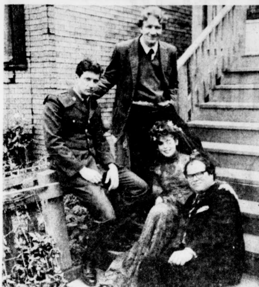
Jim Metzler (Tom) et Craig Wasson (Danilo, un immigrant venu de Yougoslavie), assistent au mariage de leurs amis Jodi Thelen (Georgia) et Michael Huddleston (David) dans le très beau film d'Arthur Penn GEORGIA qui est à l'affiche du cinéma Cartier, ce soir et demain, de même que le 30 sept. et les 6, 12, 18 et 26 octobre.