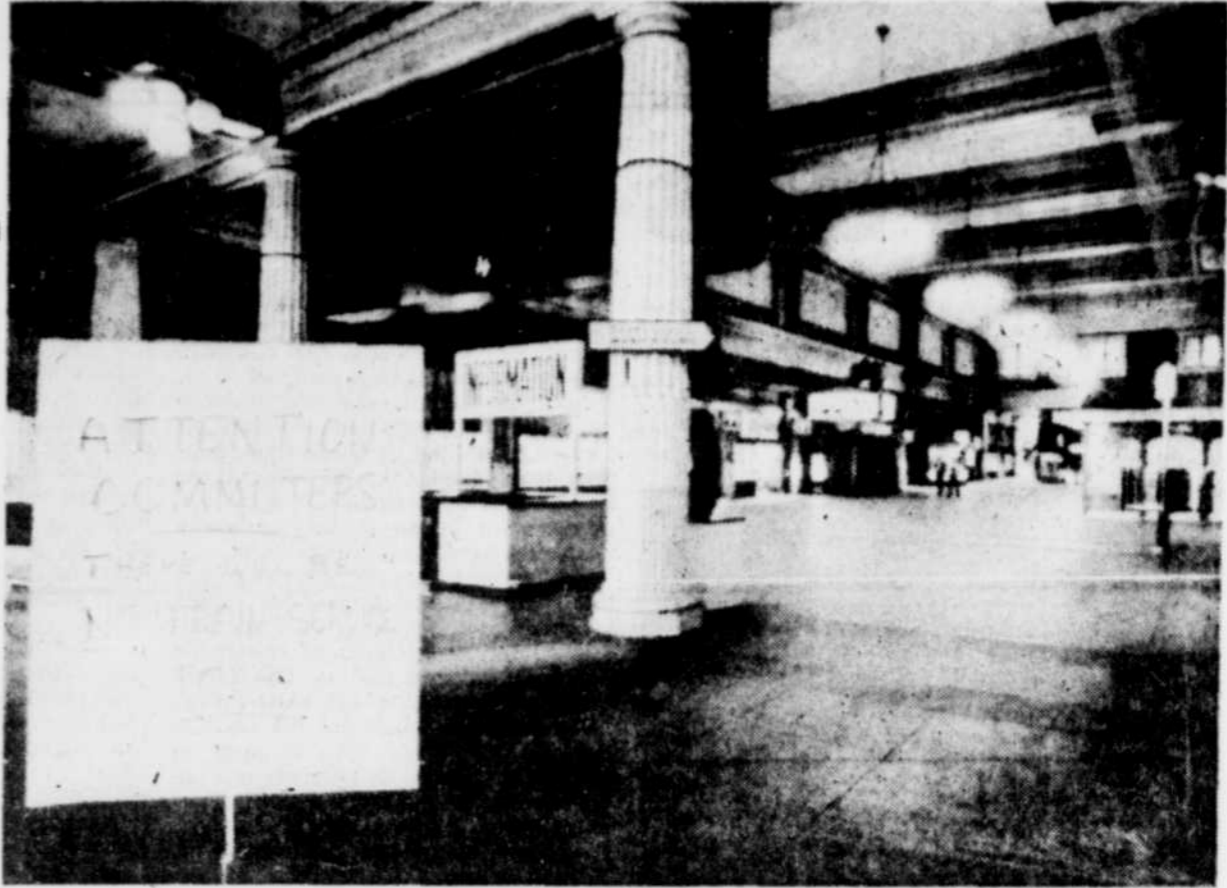
A Chicago, une affiche invite les usagers du chemin de fer à se chercher d'autres moyens de transport.