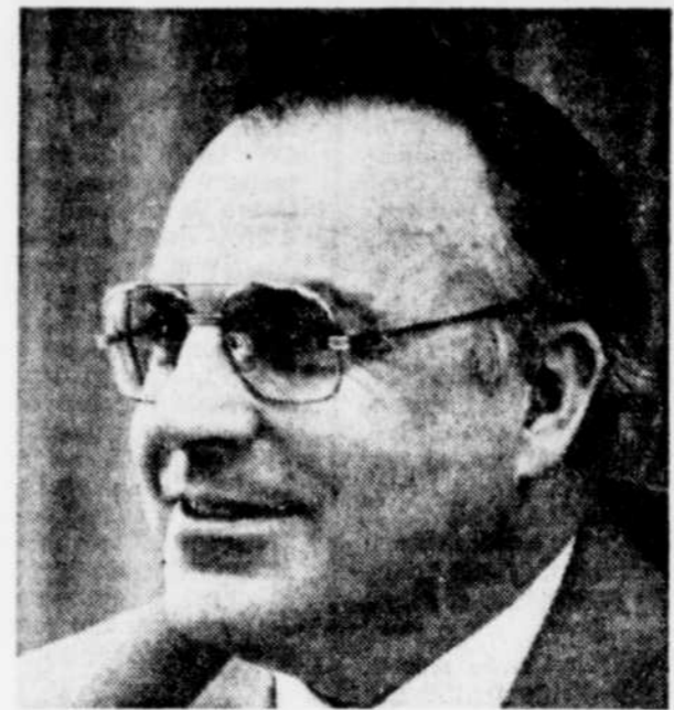
Helmut KOHL, futur chancelier

Les libéraux, qui avant leur rupture avec les sociaux-démocrates à Bonn s'étaient engagés en Hesse aux côtés des chrétiens-démocrates, risquent en effet de rester sous la barre des 5 pc des voix prévues par la constitution, en dessous de laquelle ils disparaissent de la scène politique en Hesse.