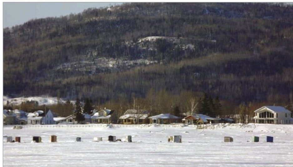
La pratique de la pêche blanche mène fréquemment à des dérives, en début de saison, comme ça s'est produit le 4 janvier à Shaw's Cove, à Dalhousie Junction.

Shaw's Cove est un endroit privilégié pour ce type de pêche. Chaque année, une cinquantaine de cabanes y sont installées.