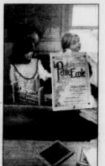
La petite école

Une courte vidéo résume au visiteur le volet musée de la boutique. Depuis le début des années 1970, les Ateliers Plein Soleil se sont donné comme mission de perpétuer les arts populaires en offrant à leur clientèle des tissus et des étoffes tissés à l'ancienne à leurs boutiques de Sainte-Flavie, du centre-ville de Mont-Joli et des Jardins de Métis. L'entrée au Musée des Traditions, le long de la Route des Arts, est gratuite.