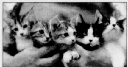
Le chat a lui aussi des humeurs.