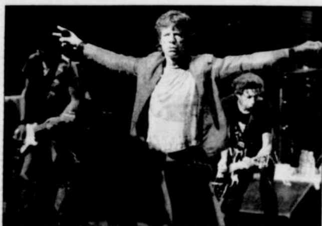
Les Rolling Stones roulent toujours leur bosse.