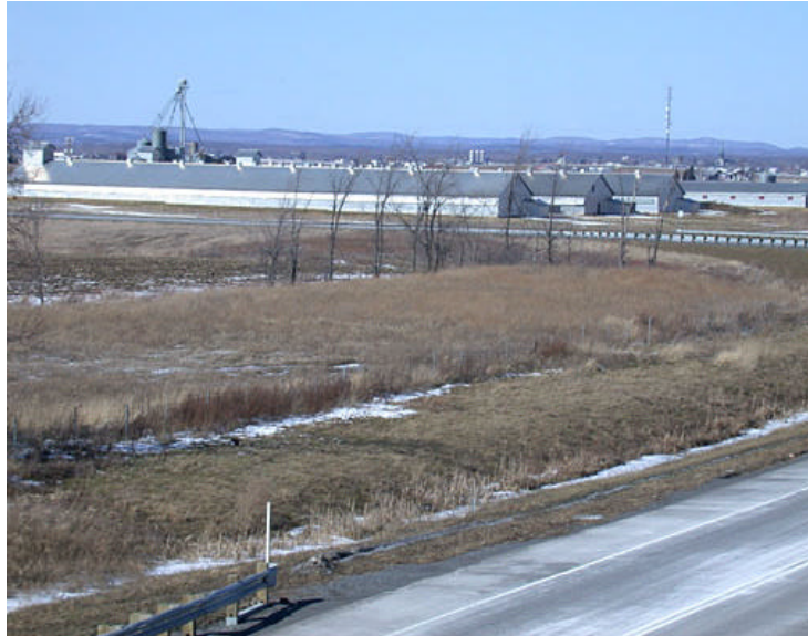
Denis Chabot, © Le Québec en images, CCDMD