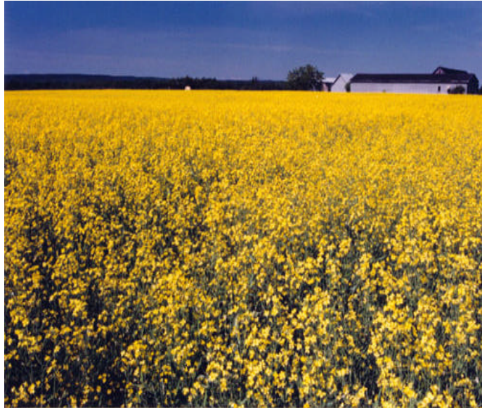
Hélène S. Dubois, © Le Québec en images, CCDMD