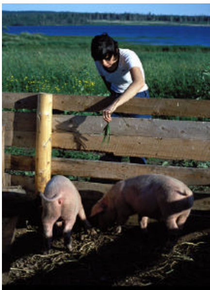
Jean-Marie Dubois, © Le Québec en images, CCDMD