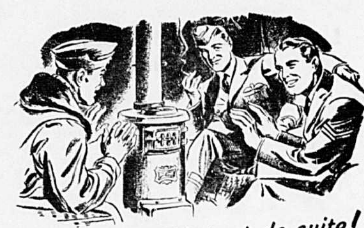
"Il me faut $200 tout de suite!"