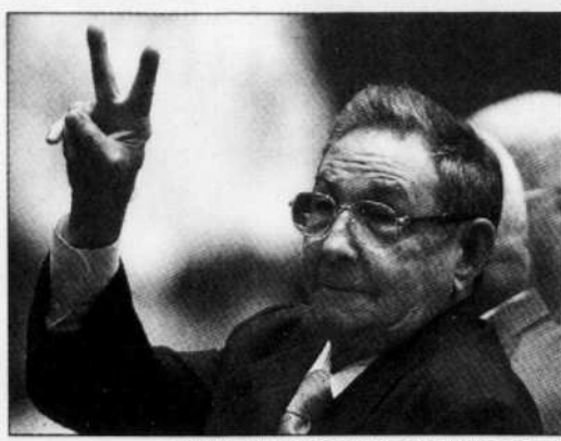
ISMAEL FRANCISCO AGENCE FRANCE-PRESSE

Les pays occidentaux, Washington en tête, attendent de lui qu'il démocratiser un régime monolithique,