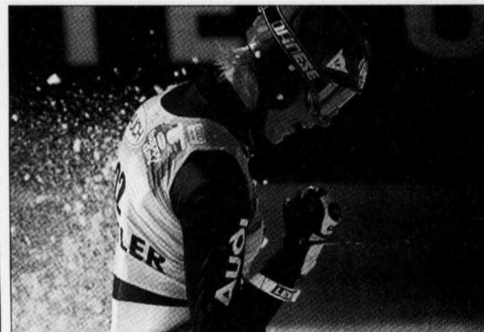
Avec sa victoire d'hier, Maria Riesch s'est sérieusement rapprochée de ses rivales au classement.