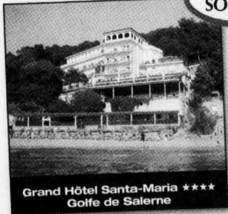
Grand Hôtel Santa-Maria **** Golfe de Salerno