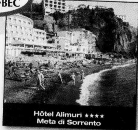
Hôtel Alimuri **** Meta di Sorrento

Le voyage inclut : le vol aller-retour Mtl/Rome, 3 jours au grand Hôtel Santa-Maria di Castellabate à Salerno, 3 jours au Mar Hôtel Alimuri à Sorrento (plan chambre et petit déjeuner) et une location de voiture 6 jours (Catégorie C). Valeur de 4100$. Maggiore National Car Rental