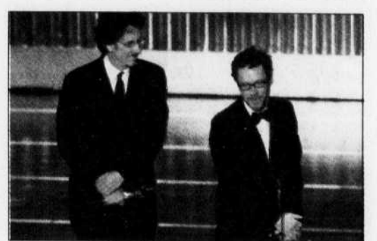
Joel et Ethan Coen ont récolté quatre Oscars pour No Country For Old Men, dont ceux du meilleur film et de la meilleure réalisation.