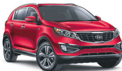
Modèle SX Luxe illustré* ROUTE (BA) : 8,3 L/100 KM VILLE (BM) : 11,4 L/100 KM*