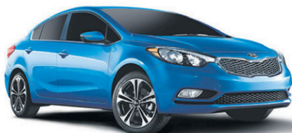
Modèle SX illustré* ROUTE (BA) : 6,1 L/100 KM VILLE (BM) : 8,8 L/100 KM*

FORTE LX BM 2015 Clef d'or « Meilleure de sa catégorie » L'ANNUEL DE L'AUTOMOBILE 2015