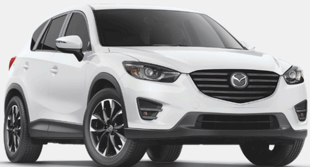
Modèle Mazda CX-5 GT 4RM illustré

AUSSI OFFERT AVEC LA TRACTION INTÉGRALE (AWD)