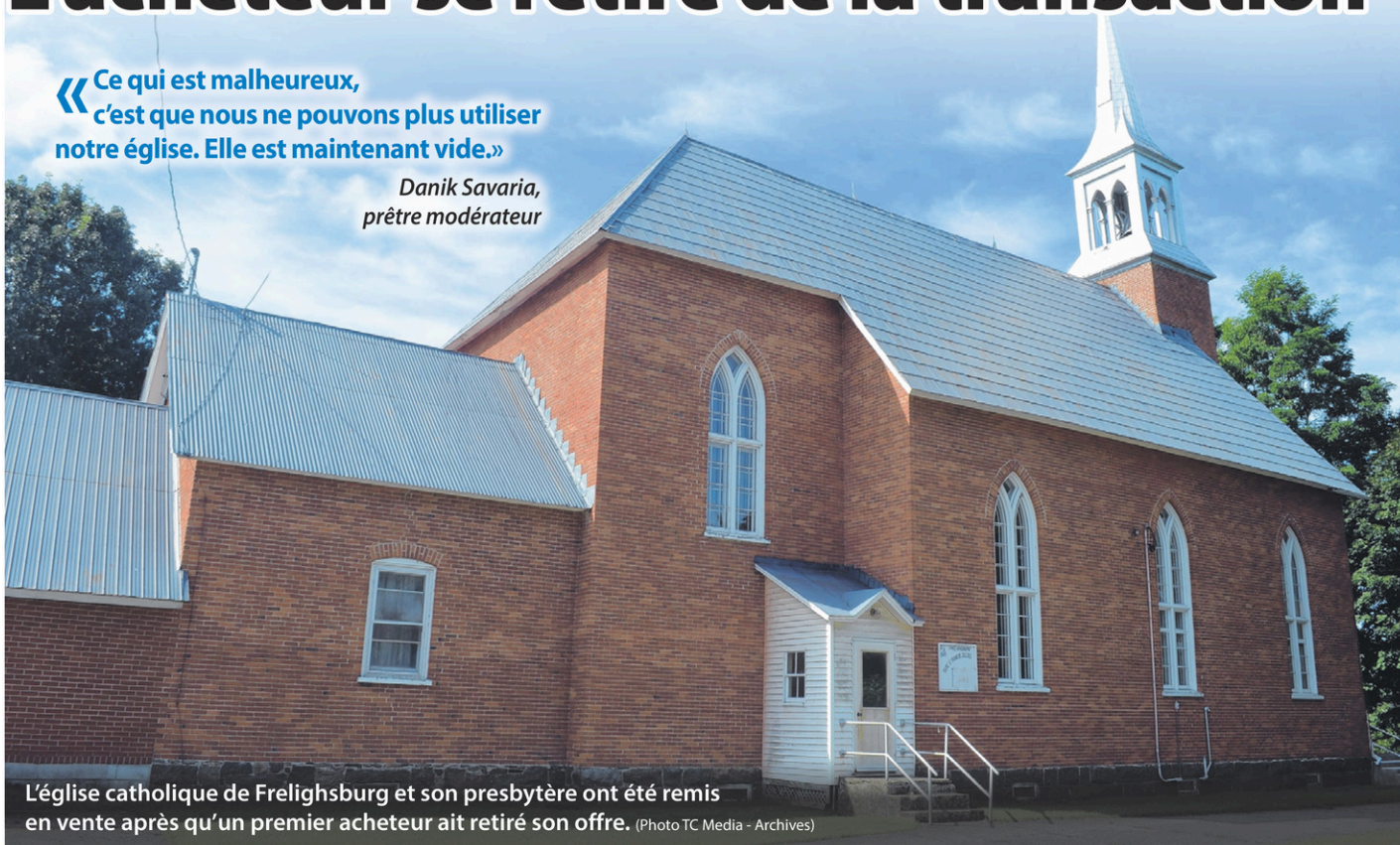
L'église catholique de Frelighsburg et son presbytère ont été remis en vente après qu'un premier acheteur ait retiré son offre.