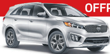
Modèle SX Turbo TI illustré* ROUTE (BA) : 9,3 L/100 KM VILLE (BM) : 12,3 L/100 KM*