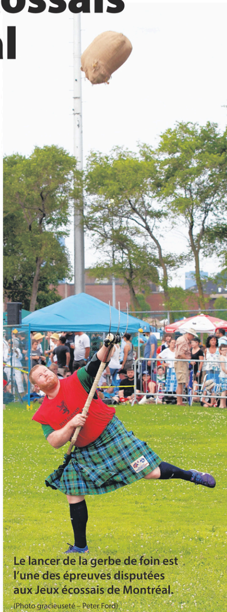
Le lancer de la gerbe de foin est l'une des épreuves disputées aux Jeux écossais de Montréal.

Le lancer de la gerbe de foin est inspiré d'une vieille tradition voulant que les fermiers balancent des bottes de foin au grenier. La gerbe a depuis été remplacée par un sac de toile