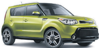
Modèle SX Luxe illustré* ROUTE (BA) : 7,8 L/100 KM VILLE (BM) : 9,9 L/100 KM*