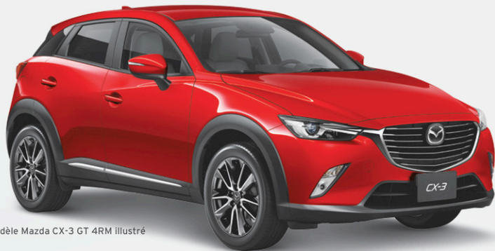
Modèle Mazda CX-3 GT 4RM illustré

LE GUIDE 2015 DE L'AUTO. MEILLEUR ACHAT VOITURE COMPACTE