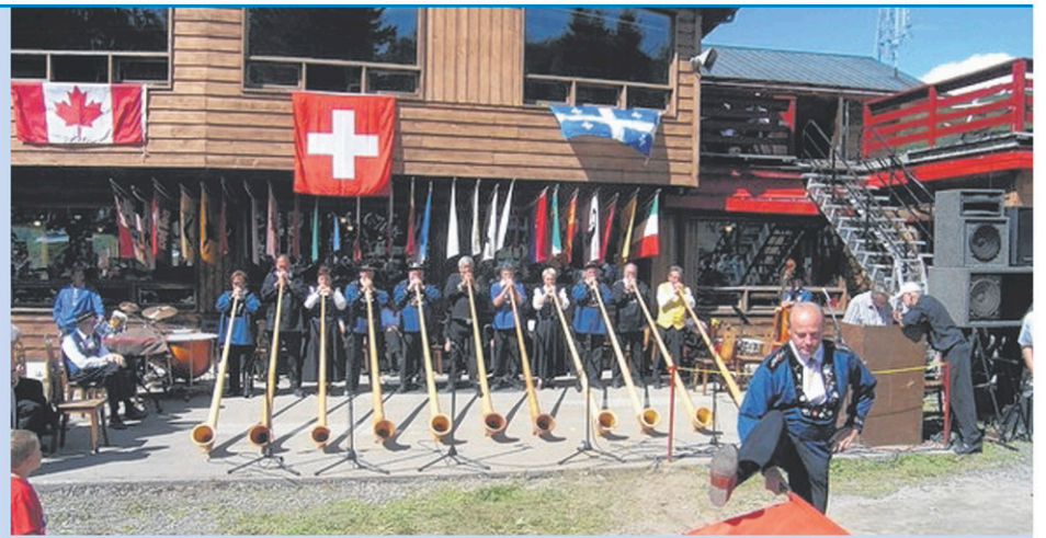
La Fête nationale Suisse de Sutton se déroule le 1 er août. Des activités typiquement suisses sont également prévues le 31 juillet.

Jusqu'à 2 fois plus de vitesse de partage!