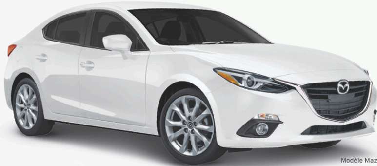
Modèle Mazda3 GT illustré

Profiter du beau soleil pour faire un choix éclairé, t'es rendu là.