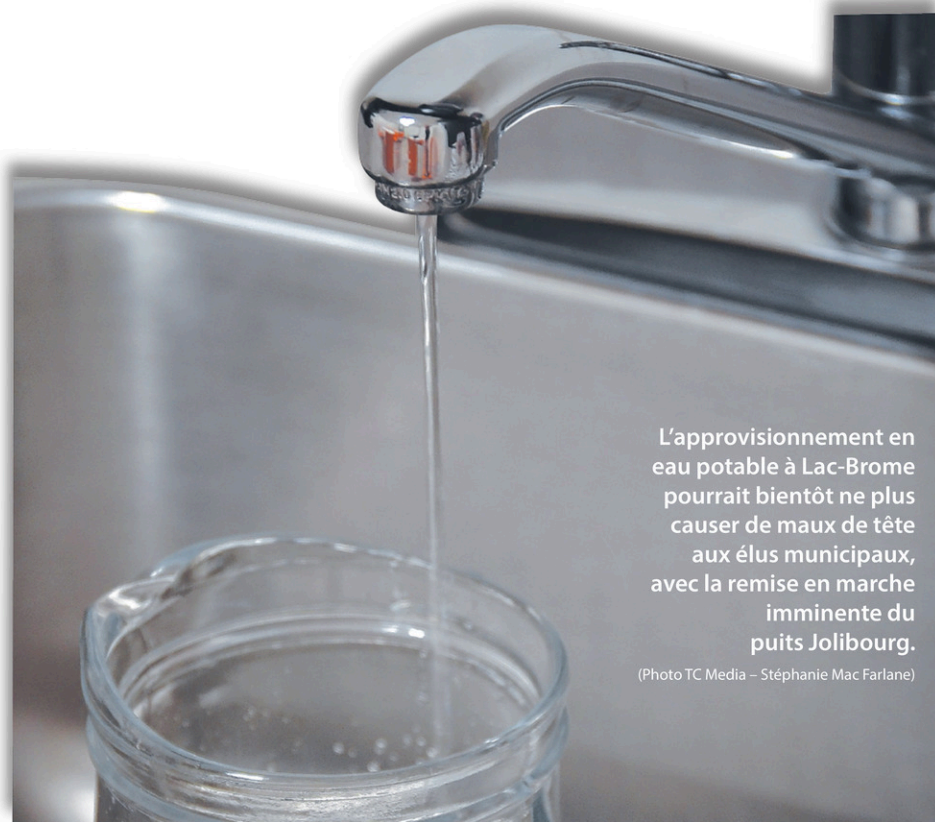
L'approvisionnement en eau potable à Lac-Brome pourrait bientôt ne plus causer de maux de tête aux élus municipaux, avec la remise en marche imminente du puits Jolibourg.

Le fonctionnement du puits Jolibourg a de particulier qu'il fournit directement le réseau d'aqueduc. L'eau du puits Bailey chemine par le réservoir Spring Hill avant d'atteindre les robinets. «Le Ministère doit s'assurer que tout est en ordre, il n'y a pas de place à l'erreur avec