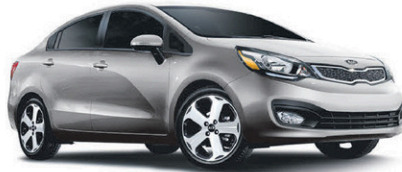
Modèle SX avec Navigateur illustré* ROUTE (BA) : 6,3 L/100 KM VILLE (BM) : 8,8 L/100 KM*

RIO LX BM 2015 Clef d'or « Meilleure de sa catégorie » L'ANNUEL DE L'AUTOMOBILE 2015