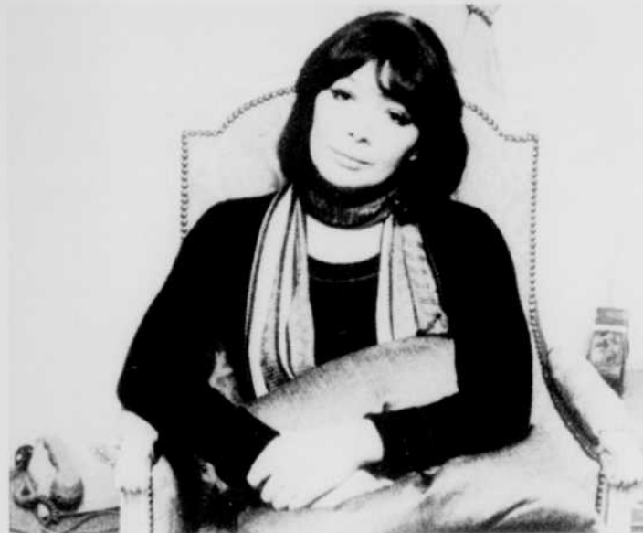
Juliette Gréco et Marcel Achard