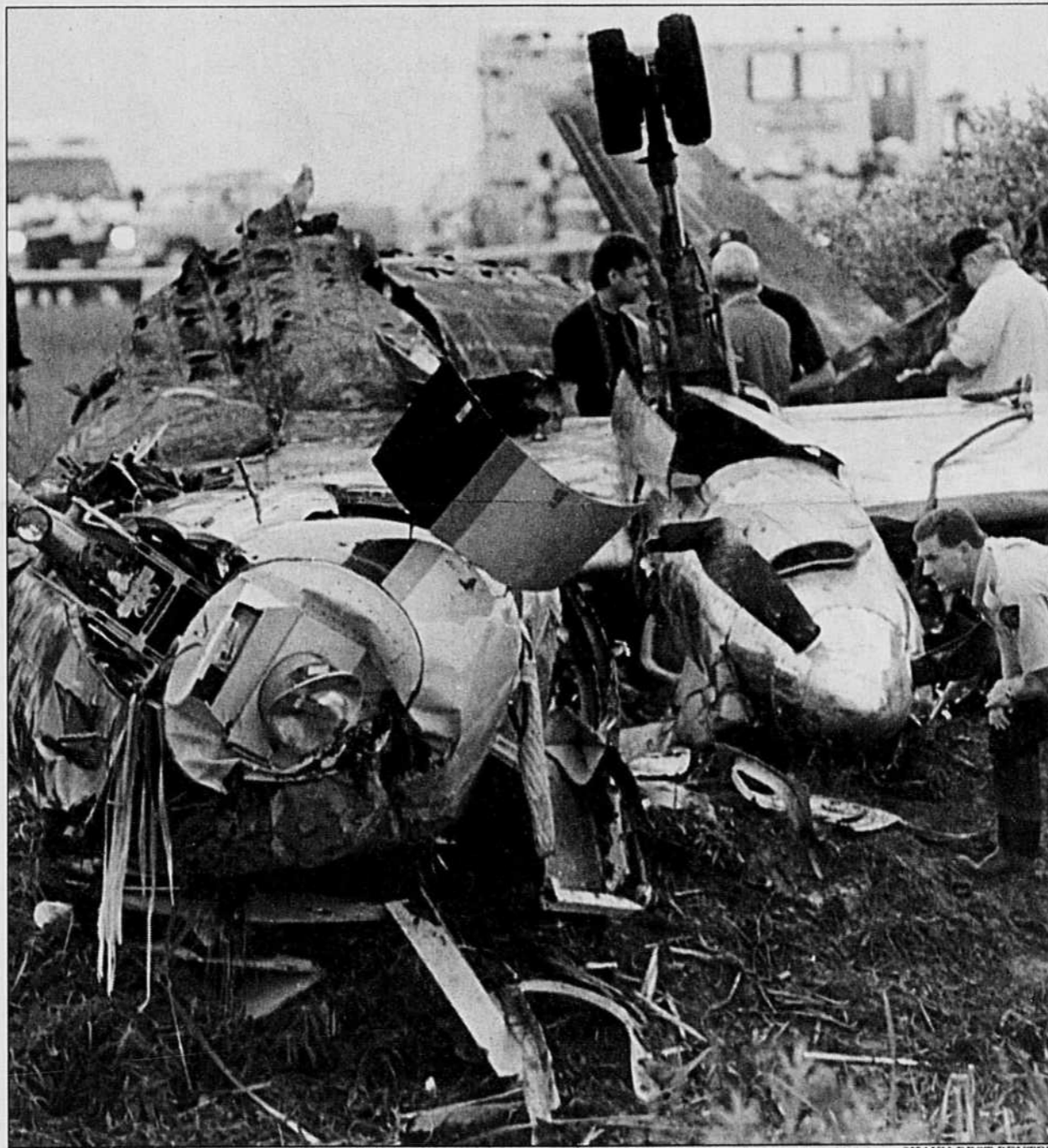
SHAUN BEST REUTER

Onze personnes sont mortes lorsqu'un avion de la compagnie Propair a pris feu, hier matin, à l'aéroport de Mirabel. Il s'agit du pilote Jean Provencher, du copilote Walter Stryker et des neuf passagers, qui travaillaient tous pour la compagnie Générale électrique du Canada à Lachine. On compte deux femmes parmi les victimes de la première tragédie aérienne de l'histoire de l'aéroport de Mirabel.