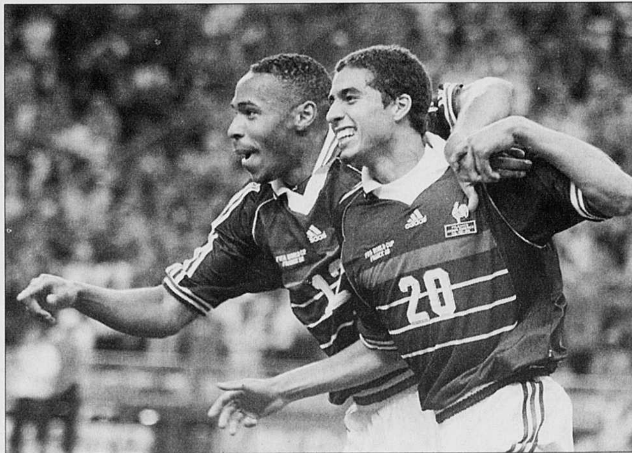
David Trezeguet et Thierry Henry jubilent à la suite du premier des quatre buts français.

Après avoir menacé de se retirer de la Coupe du monde pour protester contre la diffusion sur une chaîne de TV française (M6) d'un film jugé anti-