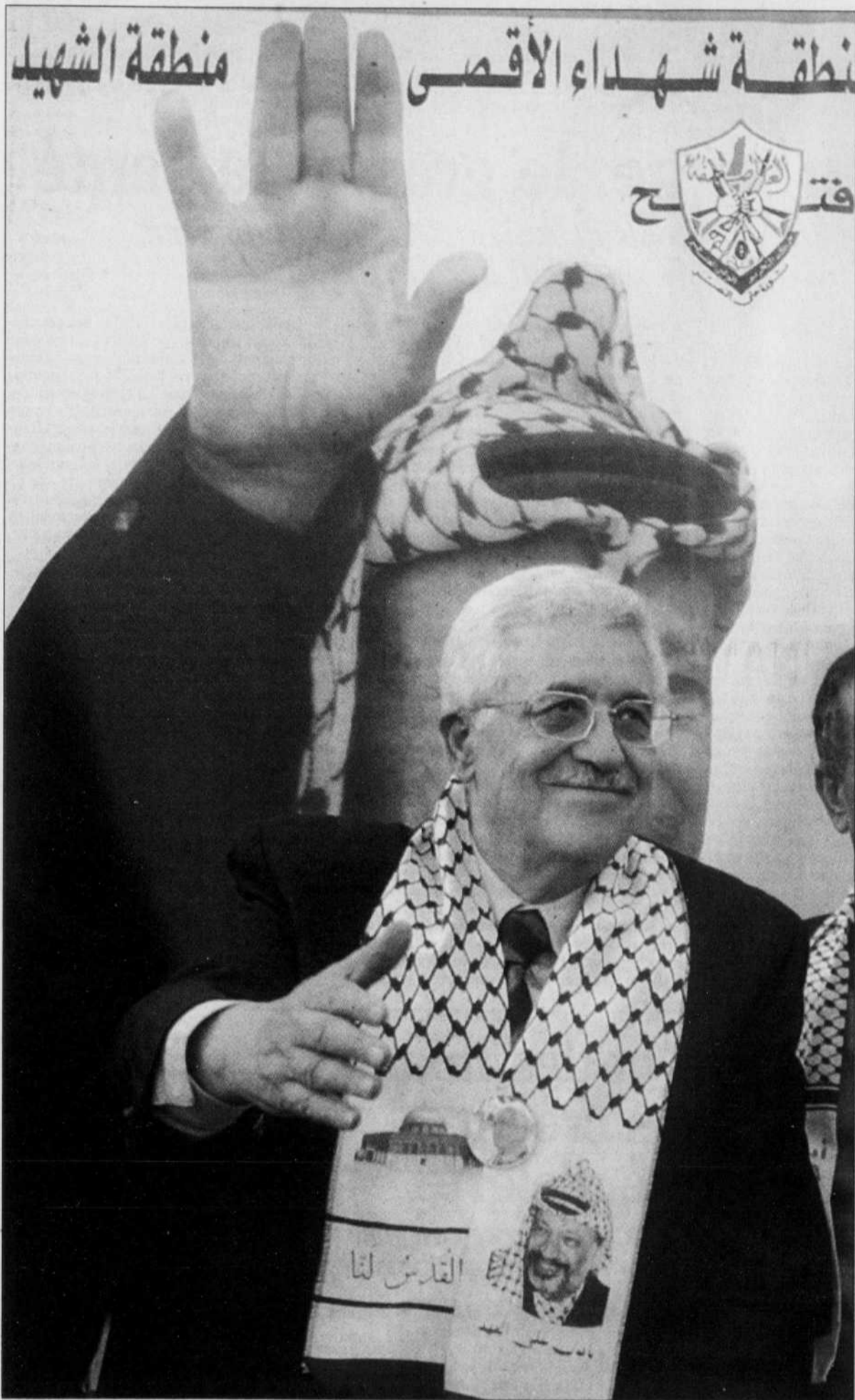
Même s'il emprunte parfois des symboles à feu Yasser Arafat, Mahmoud Abbas reste le préféré des Israéliens et des Américains.

Entre intifada et occupation israélienne, les Palestiniens vont aux urnes