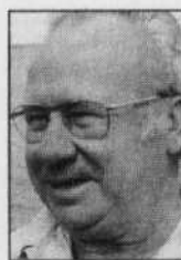
Louis J. Robichaud

dans une modeste demeure au bord du détroit de Northumberland, près de Bouctouche. Il a recherché le pouvoir politique, non pas comme une fin en soi, mais parce qu'il voulait changer les choses. C'est là, malheureusement, un art qui semble s'être perdu dans les couloirs de la politique moderne.