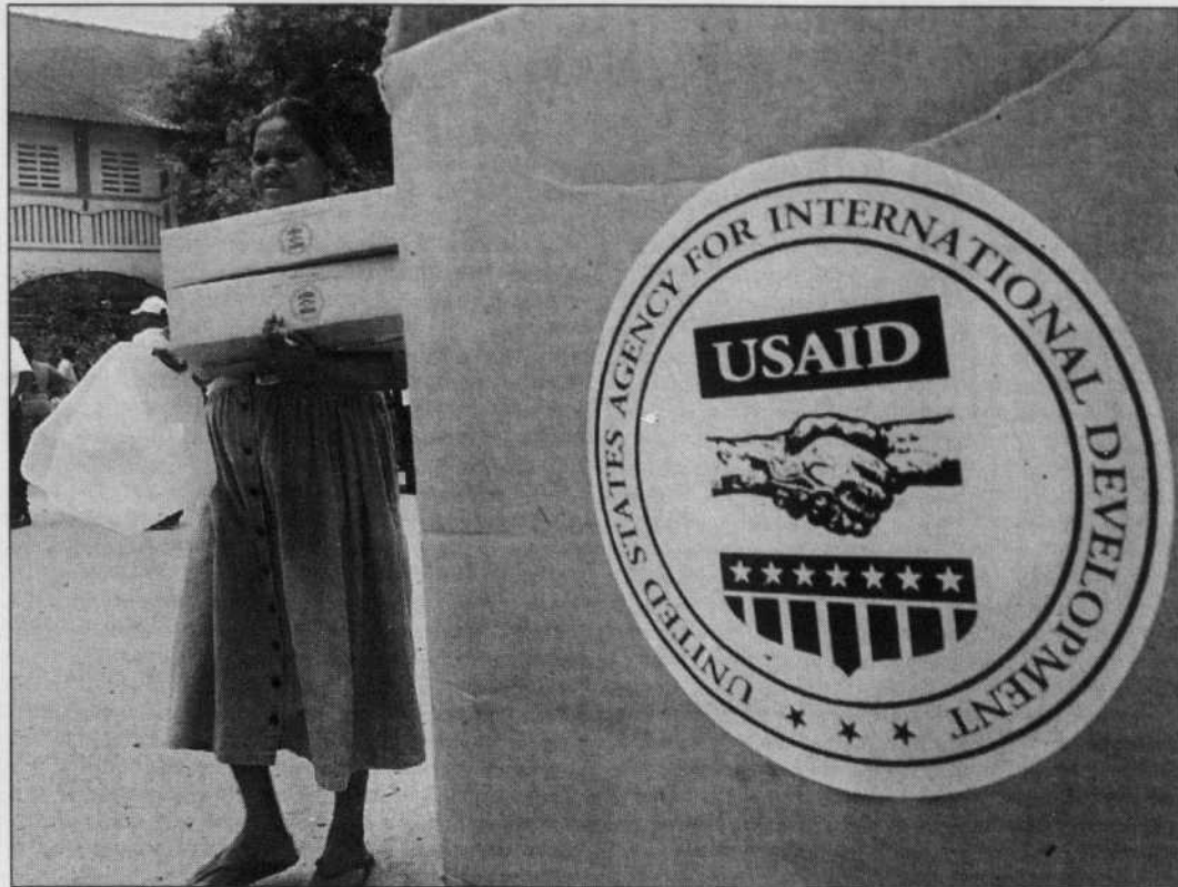
Ce ne sont pas seulement quelques pays d'Asie qui sont touchés, c'est l'humanité elle-même et, une fois encore, dans ses éléments les plus défavorisés.

Les modalités organisationnelles pourraient ressembler à celles du maintien de la paix. La Charte des Nations unies stipule qu'afin d'aider à maintenir la paix et la sécurité dans le monde, tous les États membres de l'ONU doivent mettre à la disposition