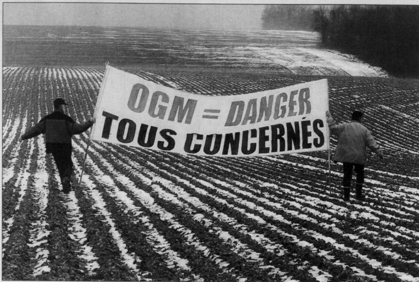
Les OGM risquent de nouveau de reprendre leur place sur le devant de la scène médiatique avec la présentation d'une étude commandée par le gouvernement du Québec et portant sur la pertinence d'un étiquetage obligatoire.