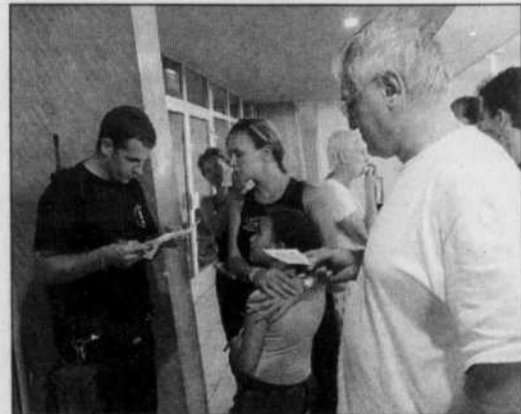
Départ des expatriés l'automne dernier.

La Côte d'Ivoire continue de ressentir durement les contrecoups des violences organisées par les Jeunes patriotes, les milices pro-gouvernementales, du 6 au 9 novembre dernier, en représailles à la destruction de la flotte aérienne ivoirienne par