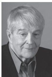
sous la présidence d'honneur de Gilles Pelletier