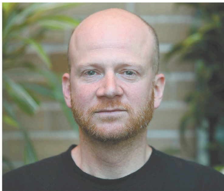
MARIE-FRANCE COALLIER LE DEVOIR

Campé dans les années 1970 et 1980, Birthmarked met en scène deux scientifiques, Catherine (Toni Collette) et Ben (Matthew Goode), qui élèvent