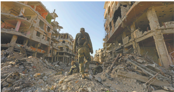
Des soldats du régime arpentent une rue détruite à l'entrée du camp de réfugiés palestiniens de Yarmouk, en Syrie, lundi.