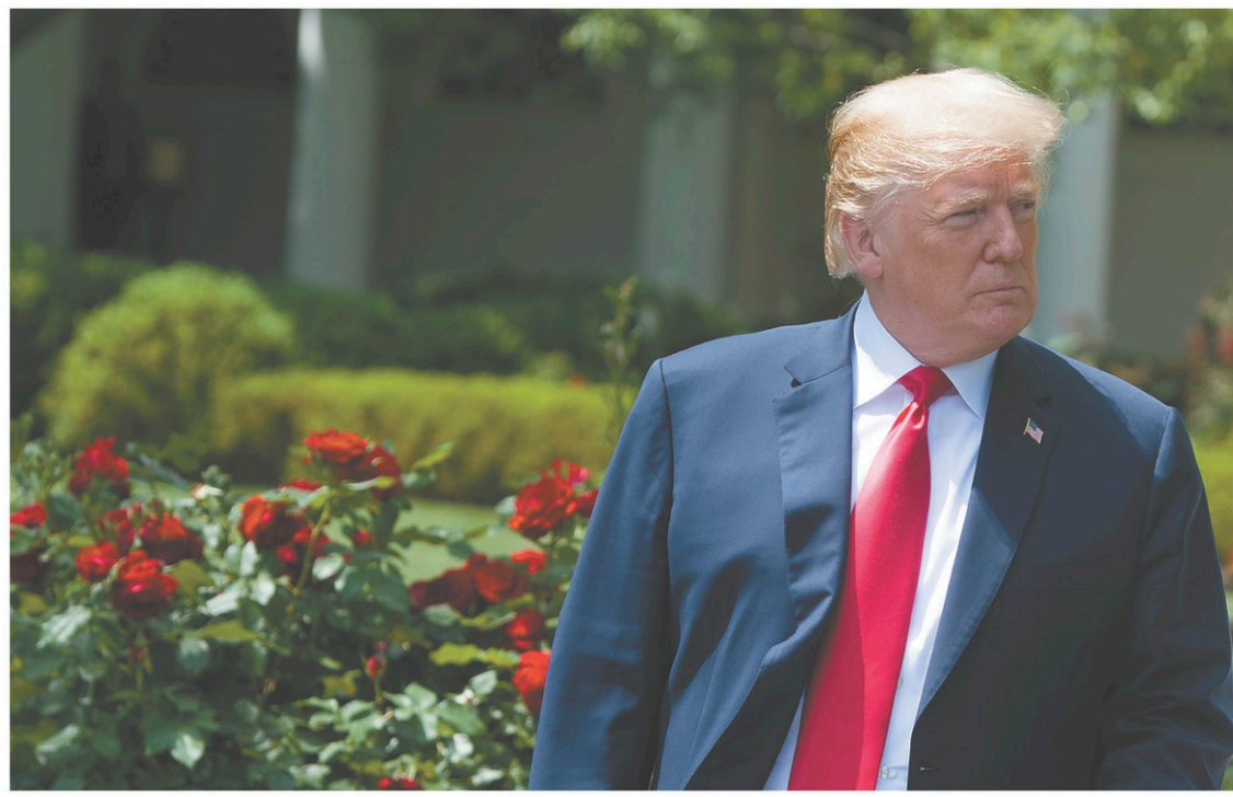
Le président américain dans la roseraie de la Maison-Blanche, à Washington, dimanche