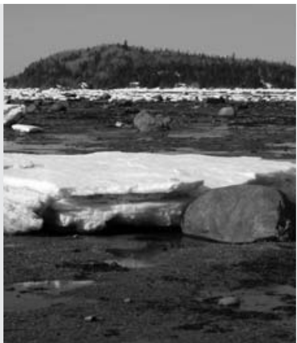
Marais salé de la Pointe-aux-Épinettes, URS Neumeier, Institut des sciences de la mer de Rimouski