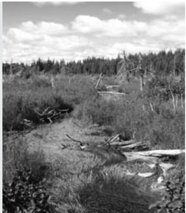
Berge auparavant inondée par le castor, habitat du campagnol-lemming de Cooper, Sépaq