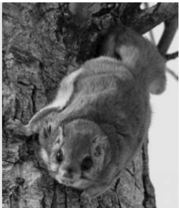
Grand polatouche, Caroline Trudeau, Université du Québec en Abitibi-Témiscamingue