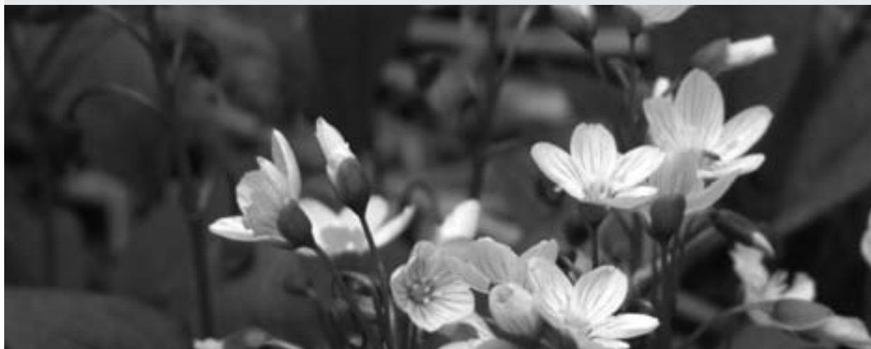
Claytonie feuille-large. Sépaq