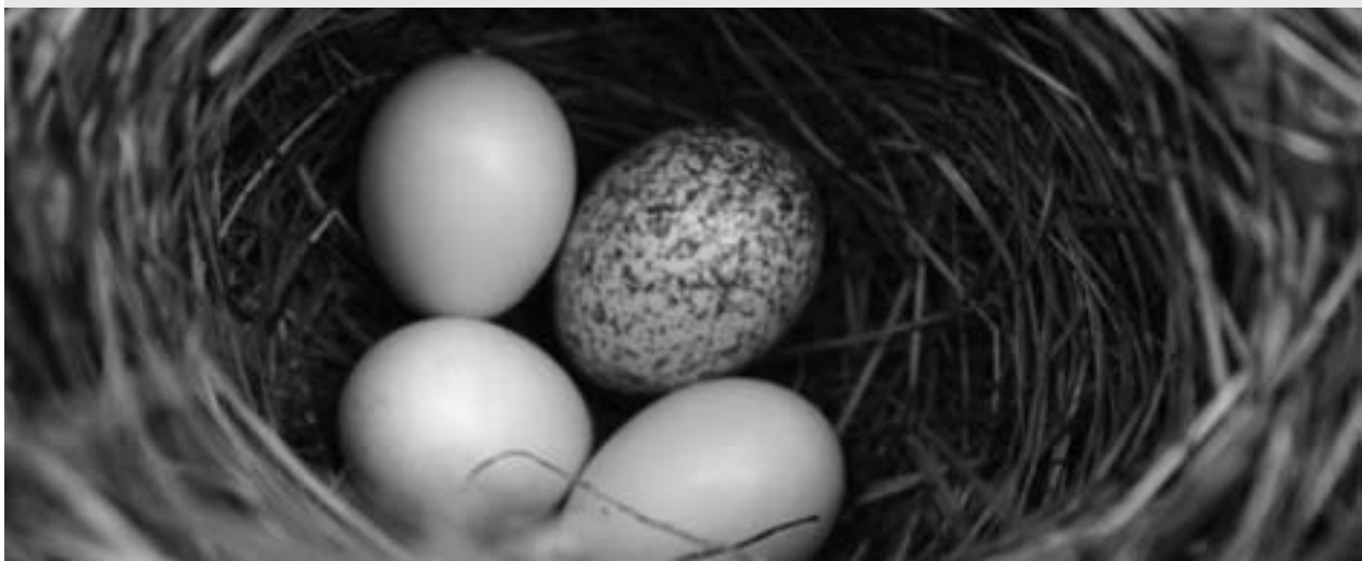
Nid de Passerin indigo dans lequel se trouve un œuf de Vacher