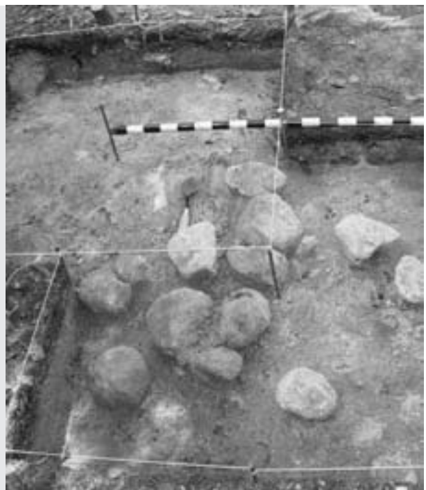
Aire de combustion terrasse de 25 m, Laboratoire d'archéologie, Université du Québec à Chicoutimi