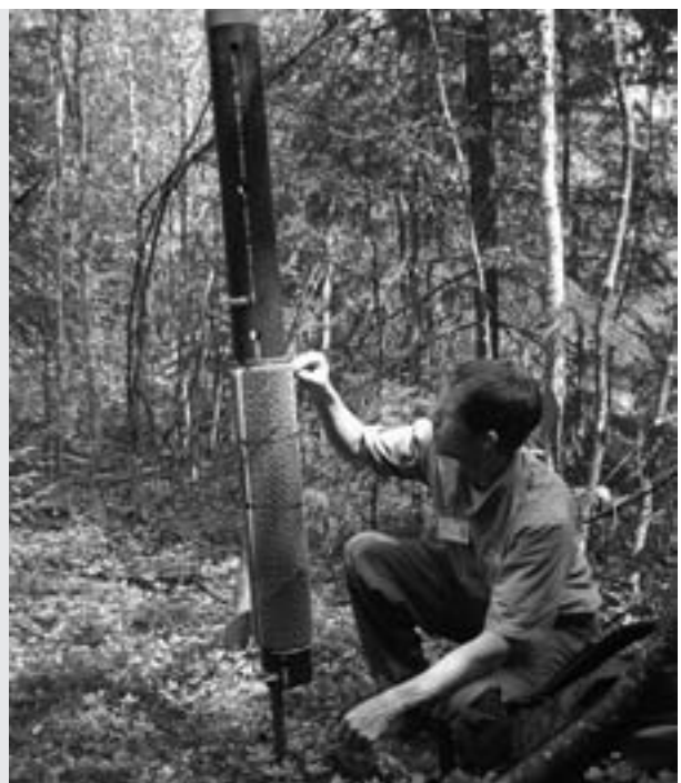
Station de dépistage du cougouar