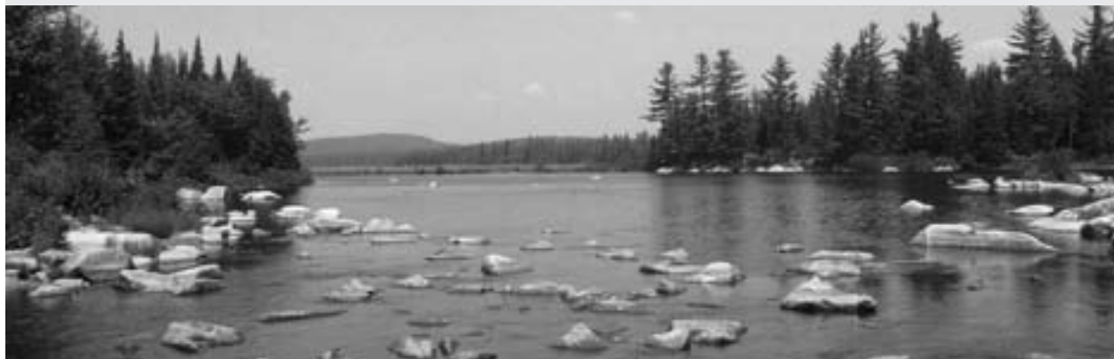
Embouchure de la rivière Felton