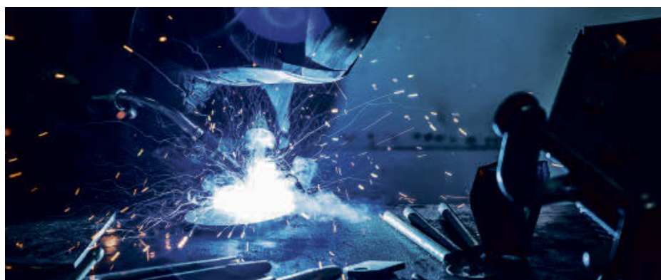
La SADC de la région d'Acton a investi auprès des entreprises environ 2,2 millions $, un record à vie. (photo Jonathan Laplante-Le Répertoire).

« Je suis très fier de la contribution que nous apportons au développement de la collectivité. En trois ans, notre