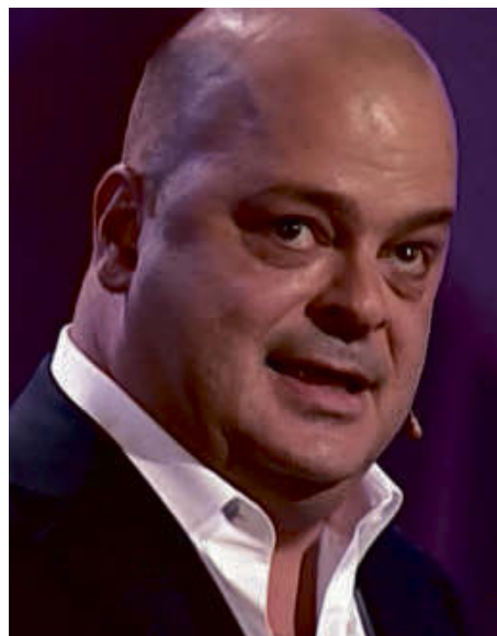
L'humoriste Sylvain Larocque sera en vedette lors du spectacle-bénéfice du 8 juin.

Les billets - 25 $ en prévente, 30 $ à la porte - sont disponibles à la Tabagie Surprise, aux Dépanneurs Voisin d'Acton Vale, au Marché Rochette de Roxton Falls, au Dépan Stef d'Upton et aux locaux de l'organisme (1018, rue Daigneault, Acton Vale). Information : 450 546-3366, www.ressources-femmes.org ou sur Facebook (« Centre Ressources Femmes »).