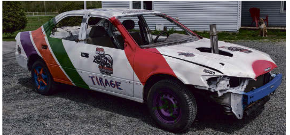
Les Guerriers Hors-Route permettront à un spectateur de vivre le derby en remportant le tirage d'une voiture. Les billets seront en vente sur place.

« Depuis deux ans, notre site est encore plus sécuritaire pour les spectateurs. C'était une priorité pour nous. Notre souhait est de divertir les gens alors, en plus des différentes courses, nous offrons les services de cantine et de bar », commente M. Casavant.