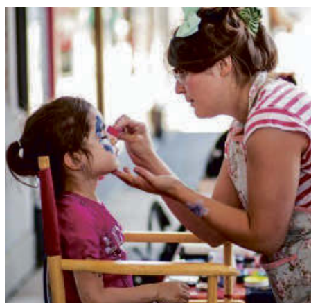
Les Productions Katomix s'occuperont de l'animation.

Par ailleurs, les résidents d'Acton Vale pourront assister le vendredi 7 juin - dans le cadre de la Semaine des municipalités - au match des Castors tout à fait gratuitement. Les billets sont disponibles à l'hôtel de ville, au journal LA PENSÉE, à la bibliothèque, au Centre sportif, à Radio-Acton, à la Caisse Desjardins et chez Pro-Cycle.