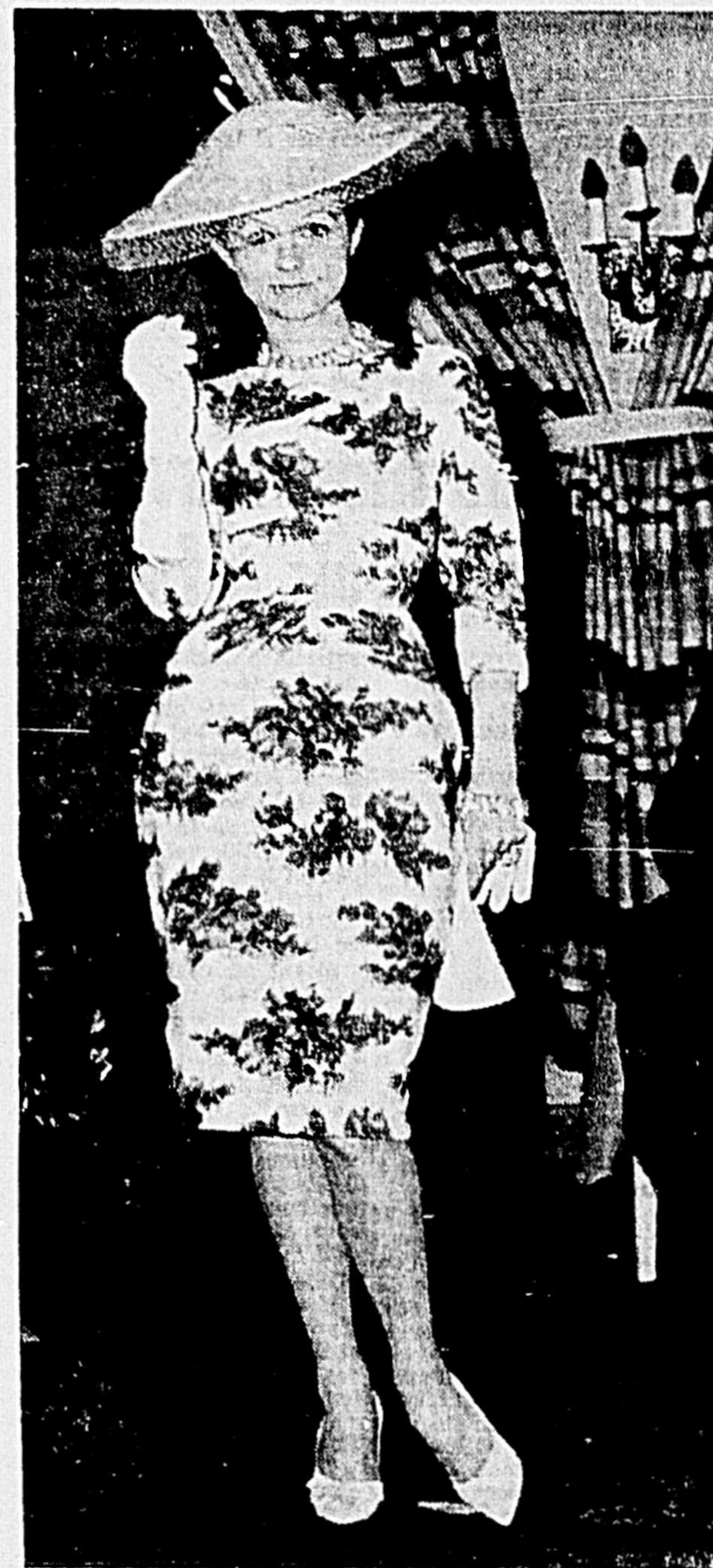
SUCCE DE L'ECLATANTE FRACINEUR DU BLANC

Nous vous présentons, en page féminine d'aujourd'hui, plusieurs photos illustrant ce qu'une adroite Saguenéenne peut réaliser avec un bon tissu et un bon patron.