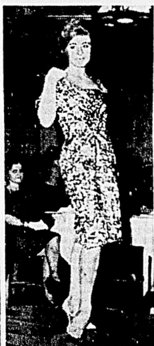
SI PETITE! SI GRACIEUSE DÉJÀ!