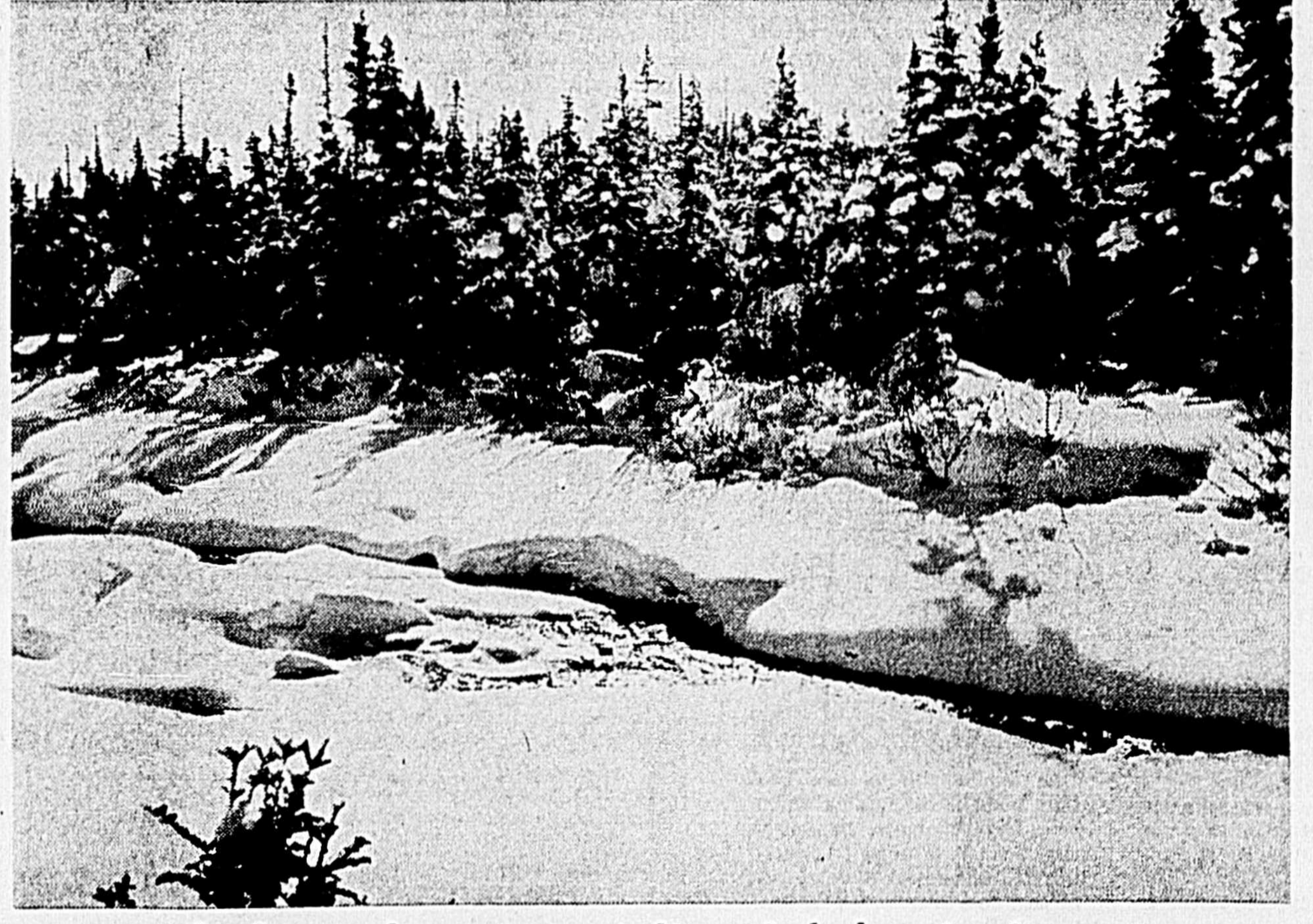
— Comme le photographe, apprenons à découvrir la beauté qui nous entoure — (Jacques BOILY)