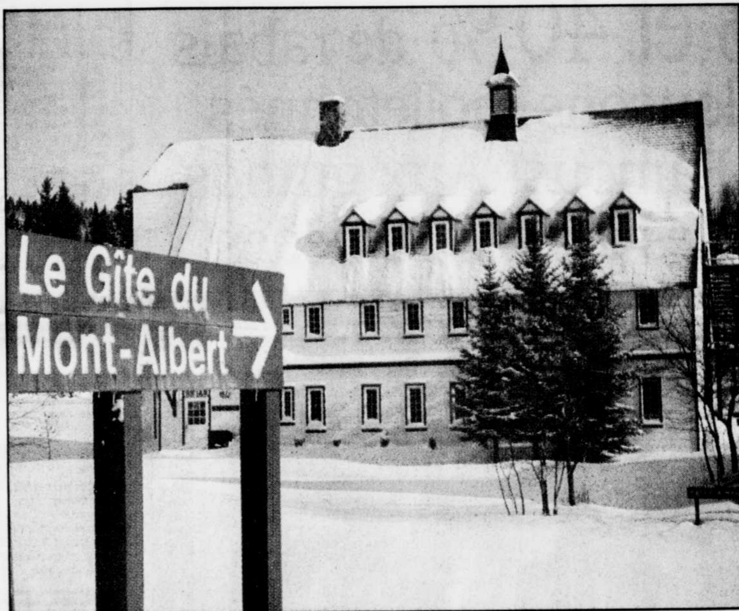
Grâce à l'ajout d'une aile identique au bâtiment existant, le Gîte du Mont-Albert, situé dans le parc de la Gaspésie, verra sa capacité d'accueil passer de 16 à 42 chambres.