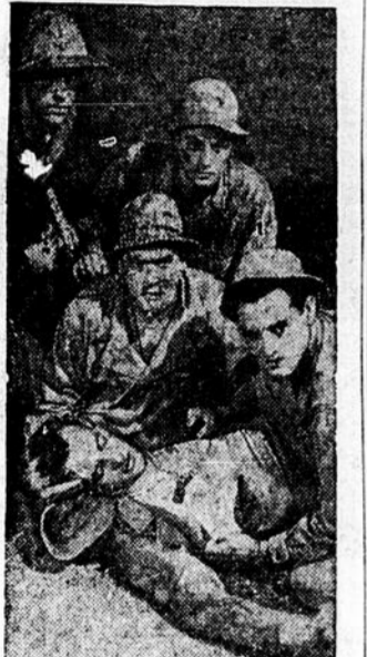
Une scène du film "There is something about a Soldier" au programme qui commence aujourd'hui et gardera l'affiche jusqu'à lundi soir.