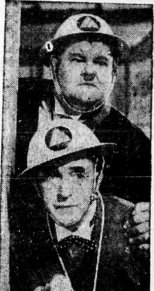
Stan Laurel et Oliver Hardy dans le film comique "Air Raid Wardens" à l'affiche aujourd'hui avec un autre grand film.