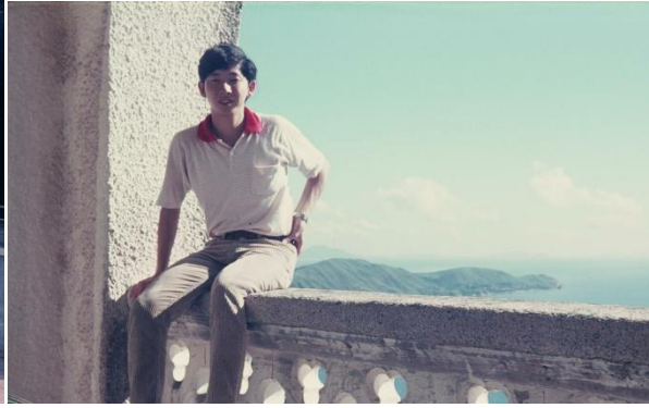
Hideo Kojima, confrère de l'auteur, Béthanie