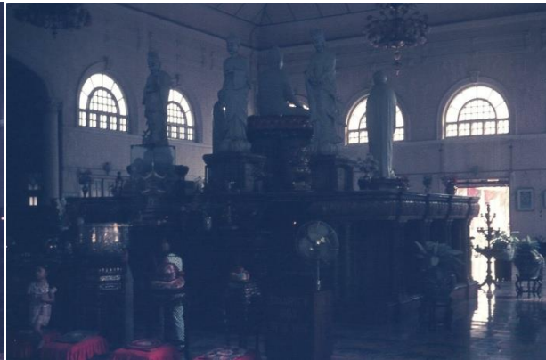
Temple chinois où les trois divinités observent les touristes partout où ils se déplacent, Penang