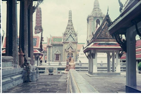
intérieur de l'enceinte du palais royal, Bangkok