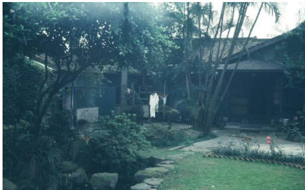
Maison habitée par l'auteur à Taïpei