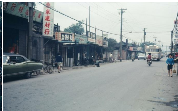
rue où habitait l'auteur, Taïpei