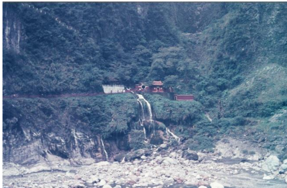
Gorges de toroko à Taiwan