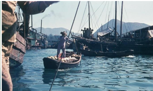
village des pêcheurs à Aberdeen, Hong kong