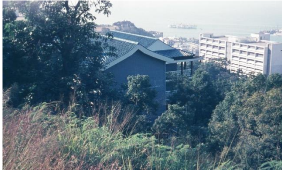
Robert Black college