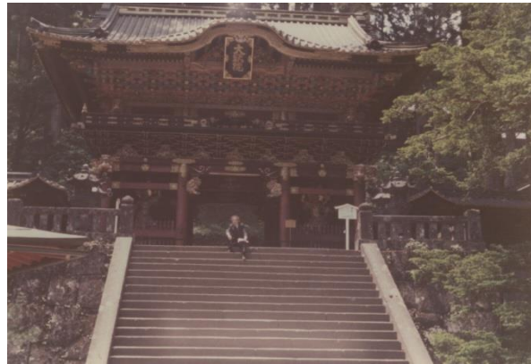
temple de Nikko, Japon