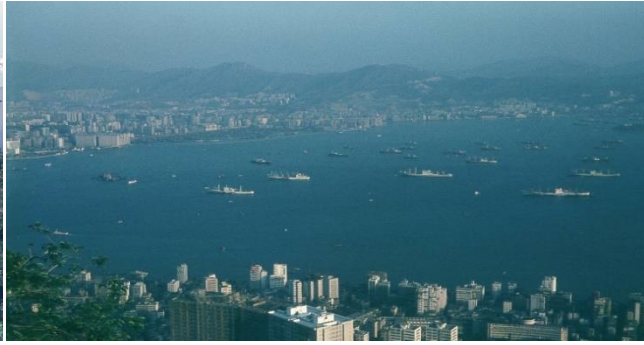
Hong Kong vue du mont Victoria