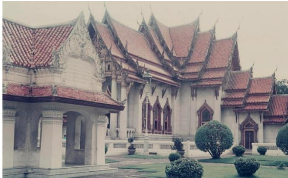
Enceinte du palais royal , Bangkok