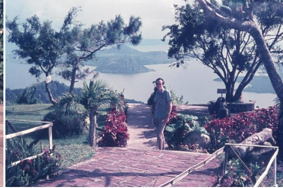
lac de Taal, Philippines