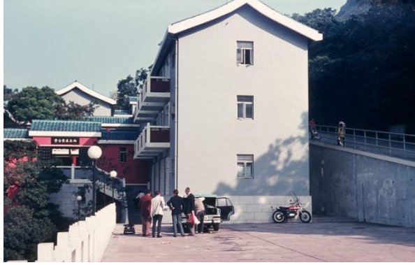
Robert Black college