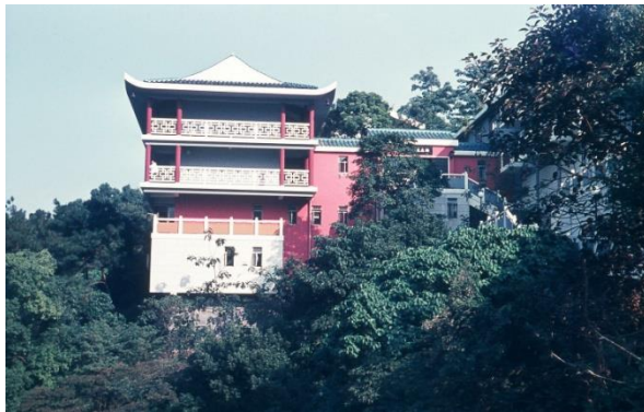
Robert Black college