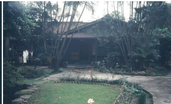
maison que l'auteur a habitée à Taipei