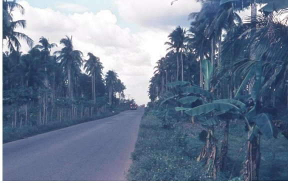
Route qui conduit au lac de Taal, Philippines