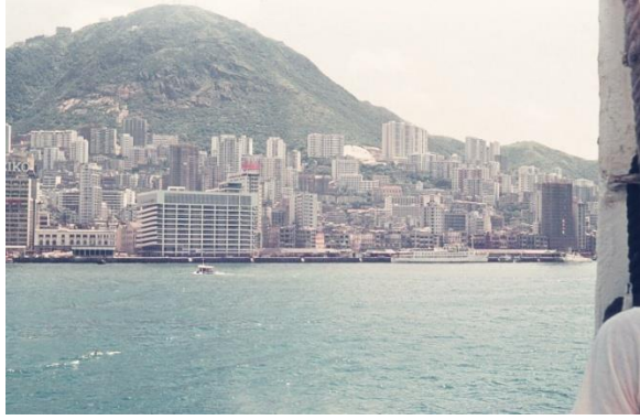
Hong Kong vue de Kowloon