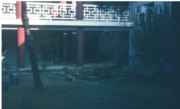
Jardin intérieur de Robert Black college