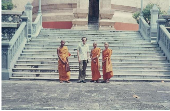
Moines bouddhistes, Bangkok