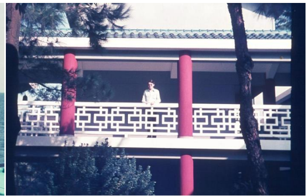
vue du jardin intérieur de Robert Black college