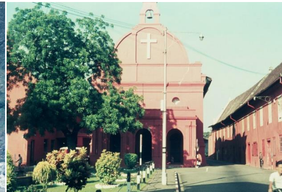
église hollandaise Malacca, Malaisie