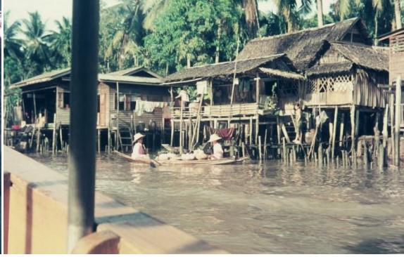
Klhong , Bangkok