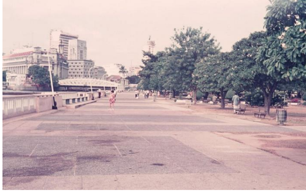
promenade Elizabeth, Singapour