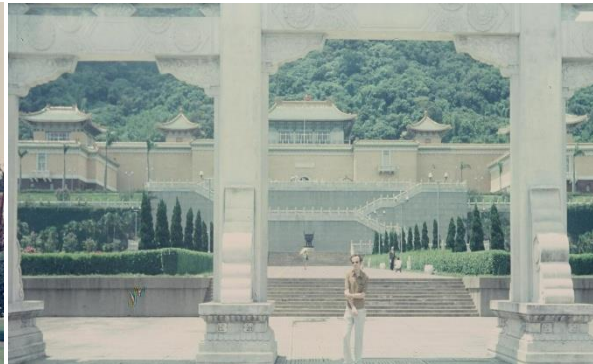
Musée national de Taïpei