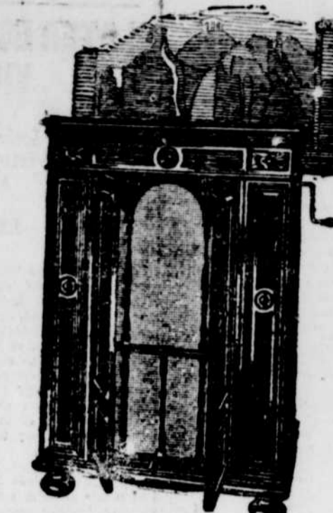
Modèle Credenza $385.

était déclaré dans un édifice que l'on avait converti en théâtre de vœux sa- mées. Toutes les victimes étaient alors pratiquement des adultes.