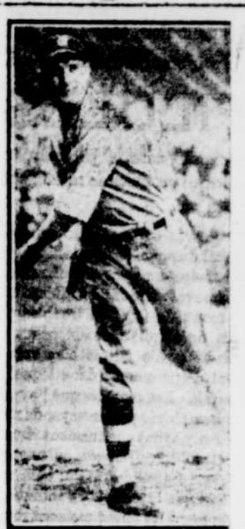
Henry MANUSH, du Detroit, à la tête des frappeurs de la ligue américaine avec un pourcentage de 377.

Une partie sensationnelle de hockey a été jouée récemment sur notre patinoire locale entre le Frontenac, pilotée par Léo Grenier et le Paper Mill. Malgré une période supplémentaire de 10 minutes le score resta de 5 à 5. Cette partie sera reprise dans un prochain avenir et lors de cette prochaine il y aura des sensations.