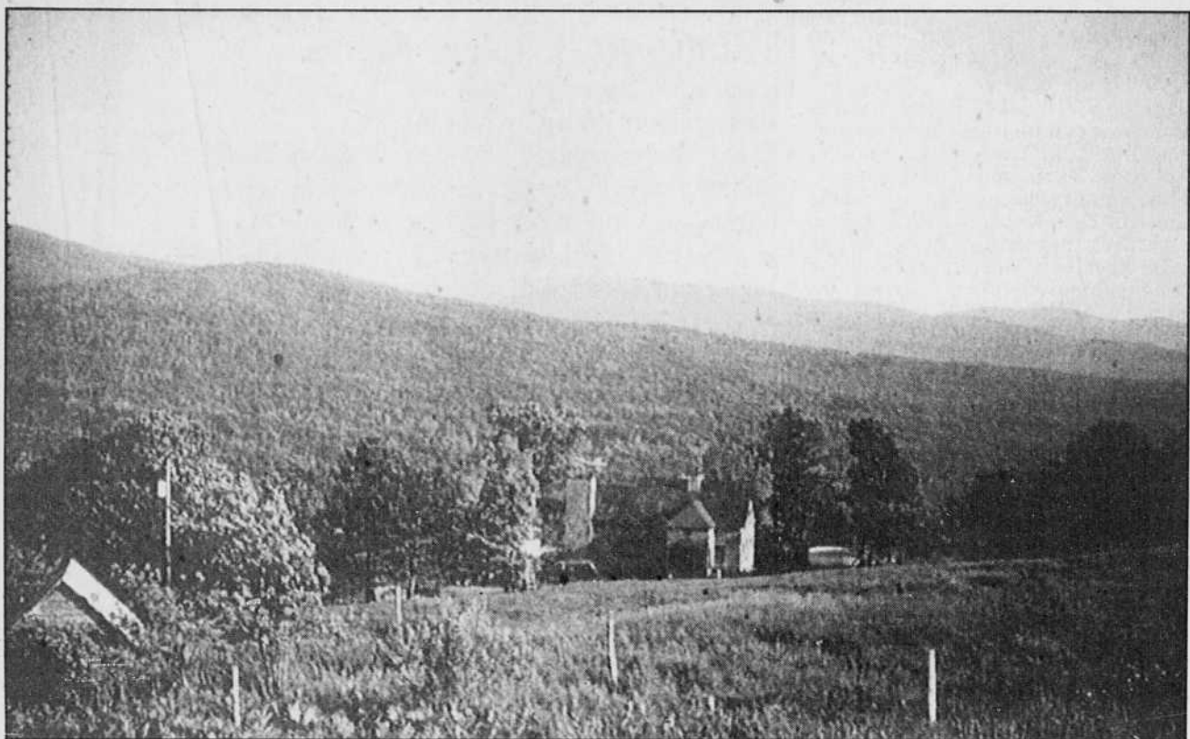
L'auberge de montagne Au Diable Vert.

* Pour s'inscrire au Sommet hivernal, du 22 octobre de 19h à 21h, ainsi que du 23 octobre 99 de 9h à 16h au chalet du Mont-Orford, on le fait par téléphone au (819) 843-3494 ou encore par télécopieur au (819) 843-4124, à la Chambre de Commerce et d'Industrie, Magog-Orford.