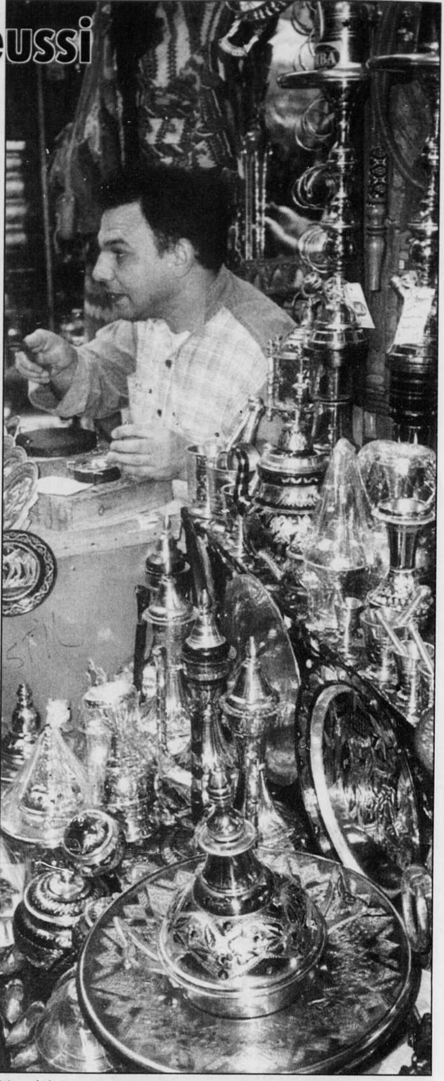
Trésors de la Tunisie, ses souks et ses marchands d'objets en tous genres.