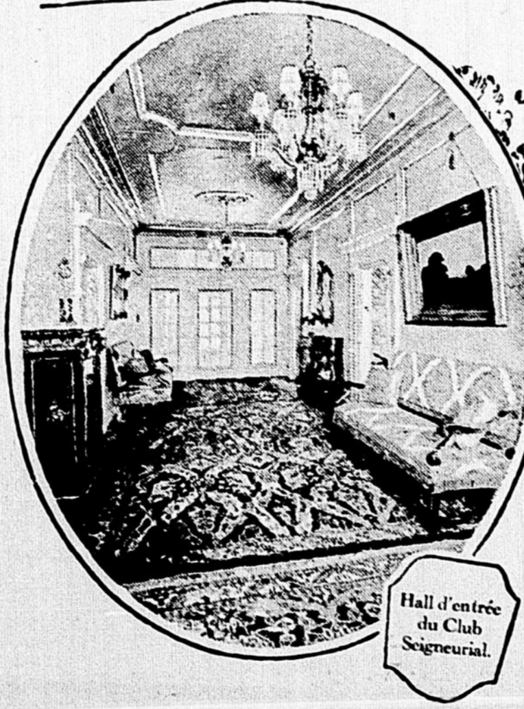
Hall d'entrée du Club Seigneurial.

Sur le côté québécois de la rivière Ottawa, à soixante-quinze milles de Montréal et à quarante-cinq milles de la capitale fédérale, s'étend un vaste domaine de plus de 80,000 acres de superficie qui, après avoir été propriété privée pendant plus de deux siècles, va maintenant devenir une immense réserve pour les sportsmen de toutes catégories, désireux de se rapprocher de la nature et d'en goûter les charmes dans un cadre vraiment rustique. C'est la Seigneurie de la Petite Nation, ancien patrimoine de la famille Papineau qui, sous l'habile direction du Pacifico Canadien, se transforme depuis quelques mois en une espèce de parc national de luxe, que l'on connaît déjà dans toute l'Amérique du Nord sous le nom de Lucerne-en-Québec.