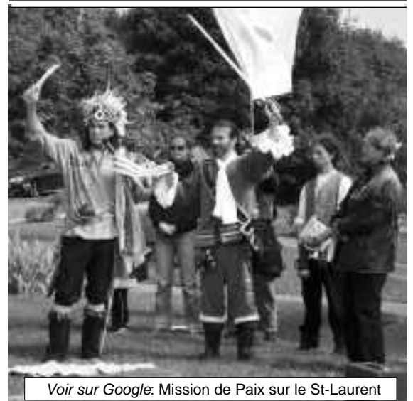
Voir sur Google: Mission de Paix sur le St-Laurent