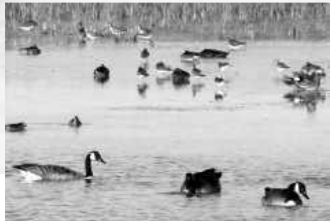
30 août, au Marais de Cacouna. Non loin d'un Chevalier solitaire, bernaches, canards et bécasseaux semblent faire très bon ménage...