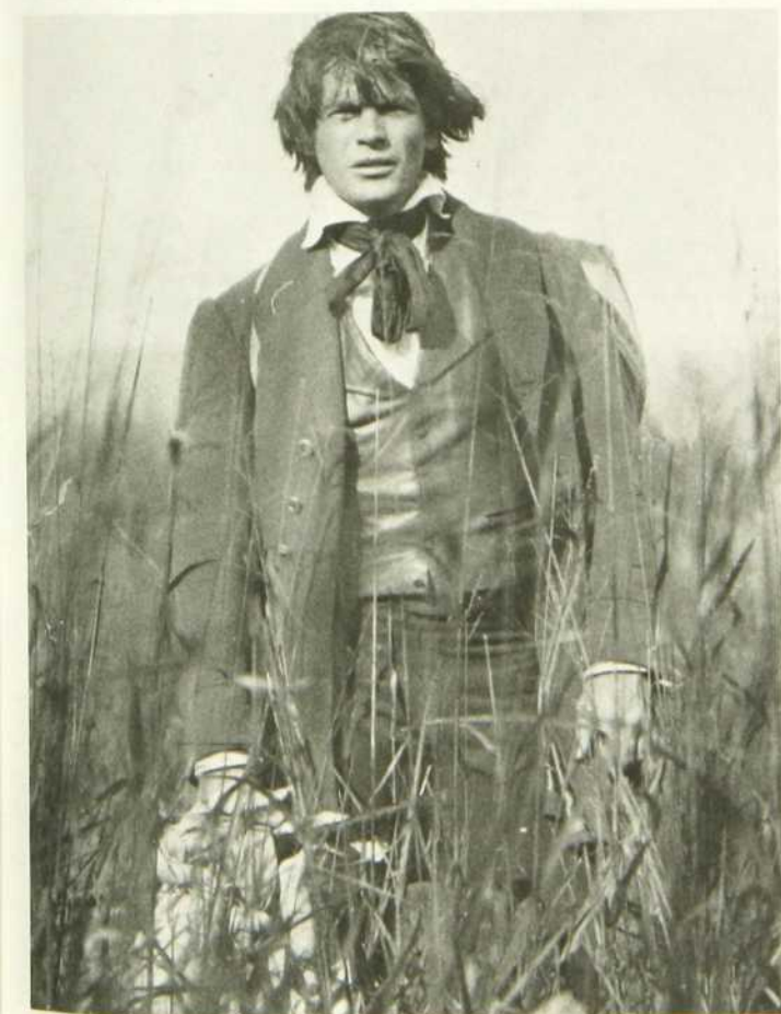
Ardéchois, Coeur fidèle

Tous les tournages ont été effectués en décors naturels dans la région parisienne, en Ardèche, en Aveyron et dans la merveilleuse région du Gard, par Jacques Renoir. Le scénario, l'adaptation et les dialogues sont de Jean Chatenet et Jean Cosmos et la réalisation assurée par Jean-Pierre Gallo pour l'ORTF et Technisonor.