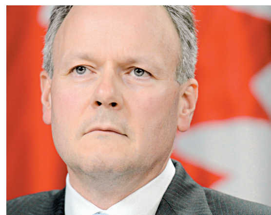
Stephen Poloz, gouverneur désigné de la Banque du Canada

Le futur gouverneur de la Banque du Canada reçoit déjà des conseils sur la politique monétaire qu'il devrait défendre à son arrivée en poste