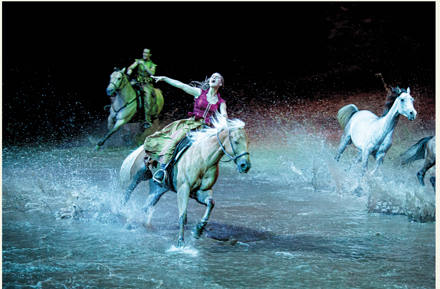
FRANÇOIS PESANT LE DEVOIR

Les 67 chevaux et 46 cavaliers acrobates de la création Odysseo fouleront à nouveau, ce mercredi soir, le sol du grand chapiteau blanc, lors de la première marquant le retour de la troupe au Québec . Enveloppés de projections en 3D sur une scène de 2500 mètres carrés, artistes et équidés referont vivre cette fable lyrique sur l'homme et le cheval, qui se termine par une cavalcade dans un bassin géant de 300 000 litres d'eau.