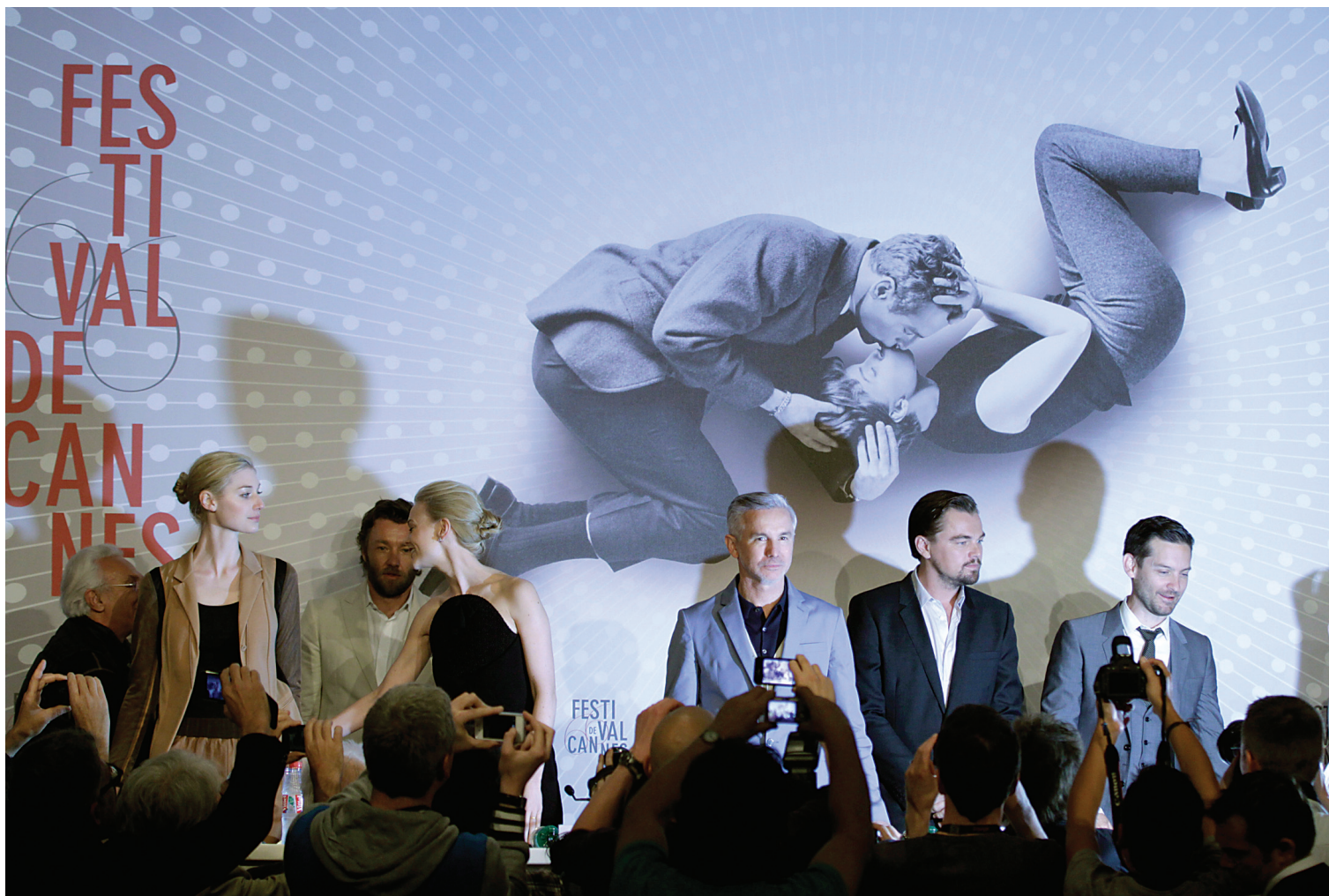
Une partie de la distribution du film The Great Gatsby entoure le réalisateur Baz Luhrmann (au centre), dont Elizabeth Debicki, Joel Edgerton, Carey Mulligan, Leonardo DiCaprio et Tobey Maguire, avant la conférence de presse traditionnelle, mercredi à Cannes.

Leonardo DiCaprio, le Gatsby de l'écran, avait souvent les yeux clos devant la