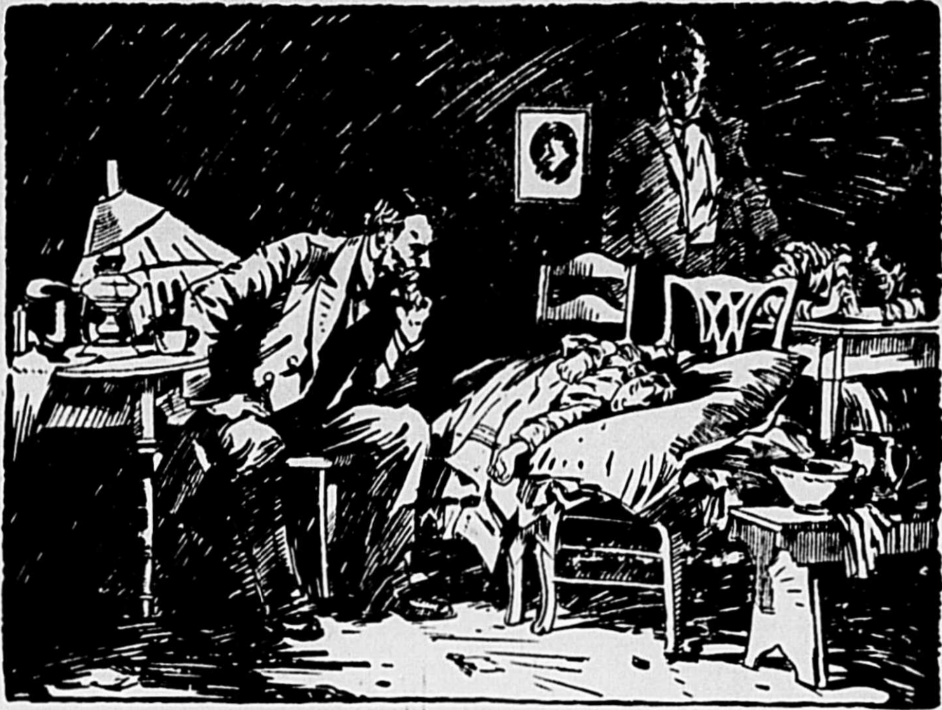
Reconnaissance à Luke Fildes