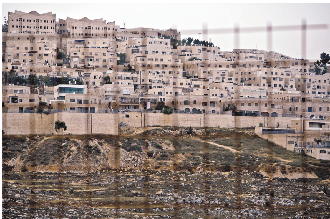
Ramat Shlomo, une colonie juive du secteur est de Jérusalem.