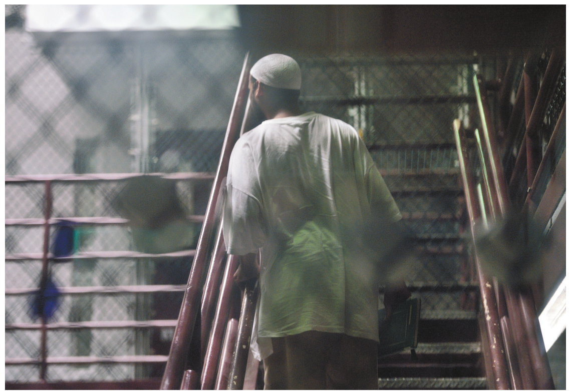
Un prisonnier de Guantánamo aurait refusé d'être « touché » par une femme lorsqu'il était escorté de sa cellule jusqu'au tribunal. Le juge J. Kirk Waits lui a donné raison, invoquant la foi musulmane.

redaction@ledevoir.com Jean-Claude Leclerc enseigne le journalisme à l'Université de Montréal