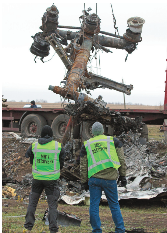
Des experts supervisaient le retrait de pièces de l'avion, dimanche.

L'Ukraine et les Américains affirment que l'appareil a été abattu par un missile sol-air fourni