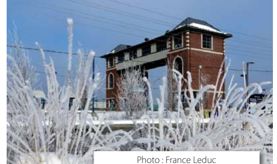
Concours de photo Le Grand Zoom