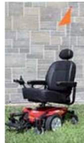
Fauteuil roulant motorisé

Utilisateurs d'aides à la mobilité motorisées