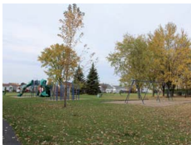
Parc du Pont-de-Pruche

Les premières réfections majeures seront effectuées de la rue Boileau à la rue Lafrance Est, entre la voie ferrée et la rue Principale (consultez la carte disponible sur le site Web).