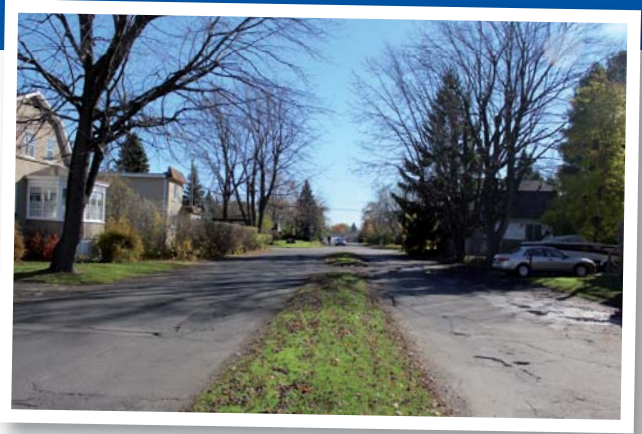
Rue Taillon Est

En décembre 2015, le programme des dépenses en immobilisations fut adopté sur six ans, laissant voir les intentions d'investissements majeurs pour le renouvellement des infrastructures, soit une estimation annuelle de 5 M $ pour les 20 prochaines années. Vu l'ampleur des travaux envisagés, il a été décidé que le financement sera dorénavant imputé à l'ensemble de la population sur tous les règlements d'emprunt relatifs aux travaux d'infrastructures (aqueduc, égouts, chaussée), sauf pour les nouvelles constructions de rues.