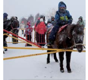
Concours de photo Le Grand Zoom

Seul un sommaire des activités, événements et manifestations spéciales est présenté à cette revue pour la période du vendredi 2 décembre 2016 au vendredi 24 mars 2017 ; consultez le calendrier du site Web pour plus de détails.