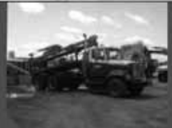
Pompe à fumier liquide