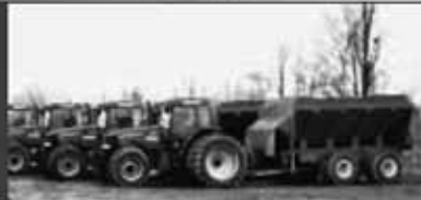
Epandeurs pour fumier solide