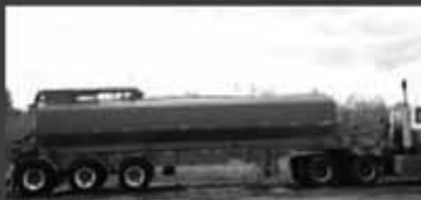
Citerne pour fumier liquide