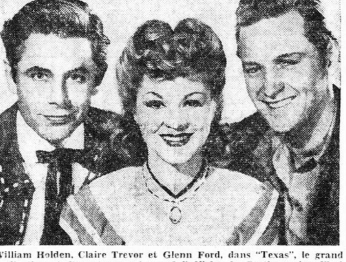
William Holden, Claire Trevor et Glenn Ford, dans "Texas", le grand film d'action et d'aventures qui prend l'affiche du Cartier aujourd'hui en programme double.