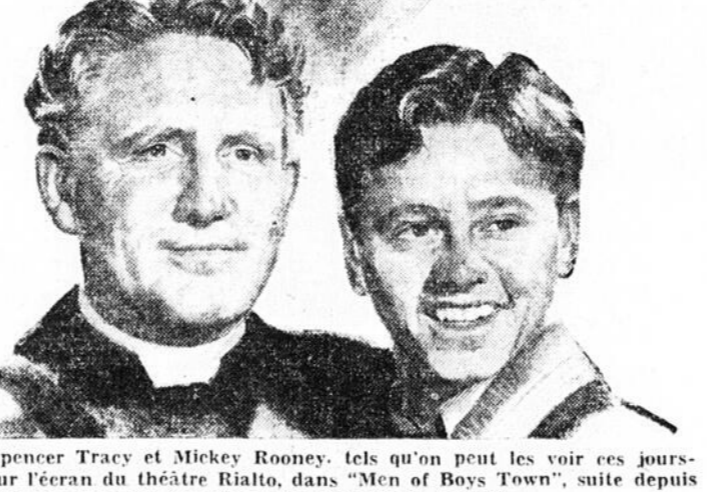
Spencer Tracy et Mickey Rooney, tels qu'on peut les voir ces jours-ci sur l'écran du théâtre Rialto, dans "Men of Boys Town", suite depuis longtemps attendue du mémorable film "Boys Town".