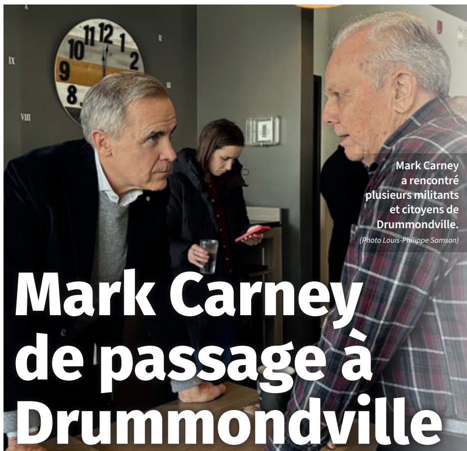
Mark Carney a rencontré plusieurs militants et citoyens de Drummondville.