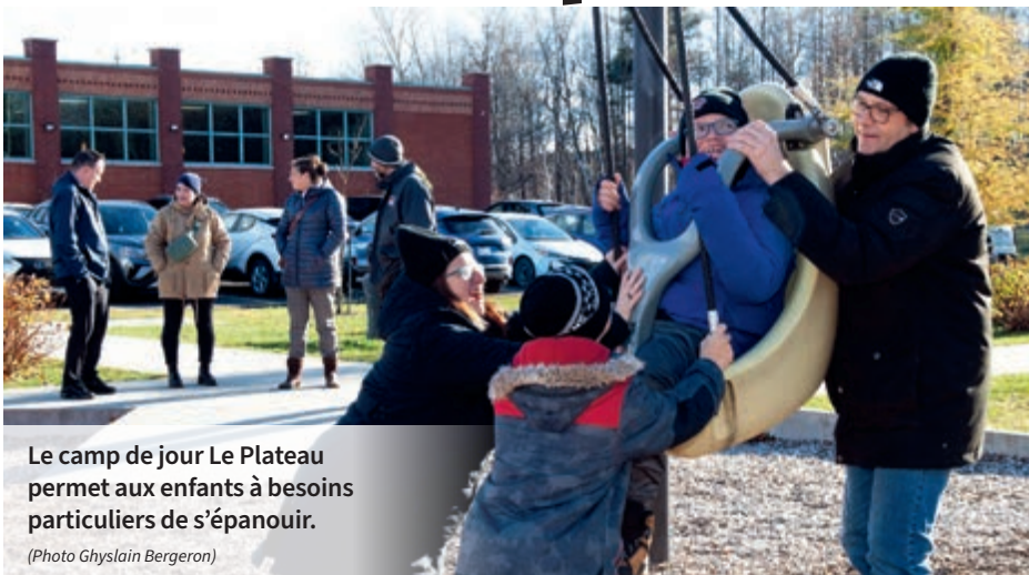
Le camp de jour Le Plateau permet aux enfants à besoins particuliers de s'épanouir.