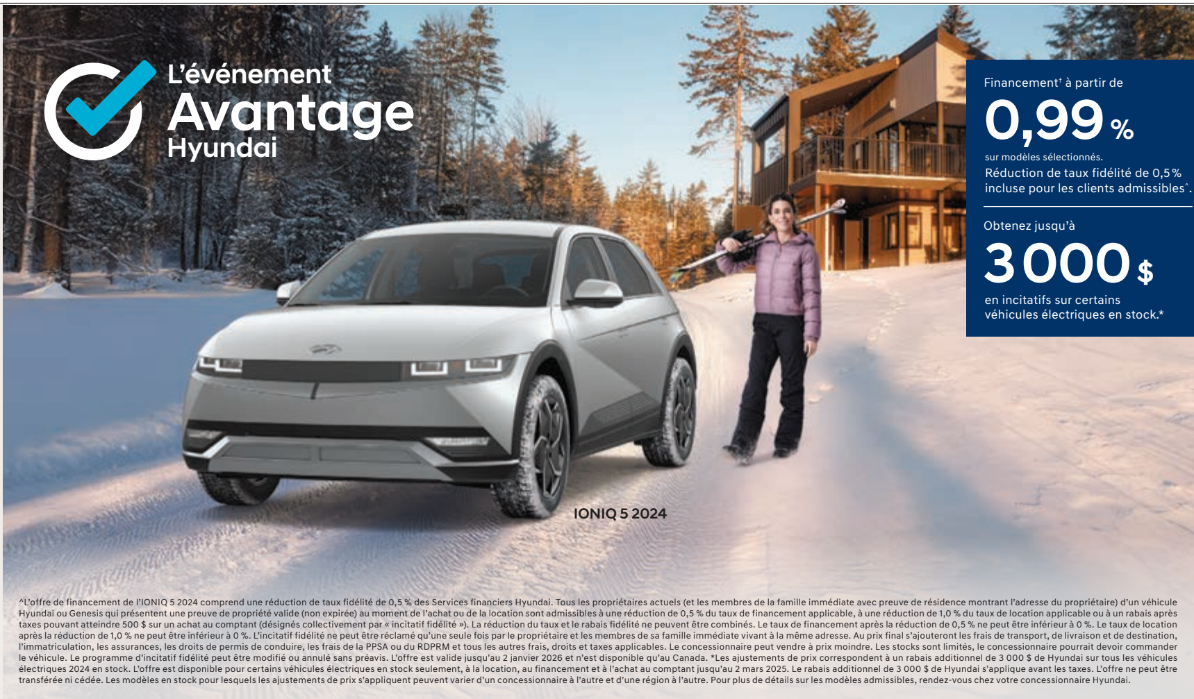
IONIQ 5 2024

en incitatifs sur certains véhicules électriques en stock.*