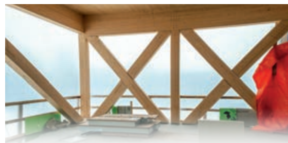
Plusieurs structures en bois resteront apparentes une fois les travaux terminés.