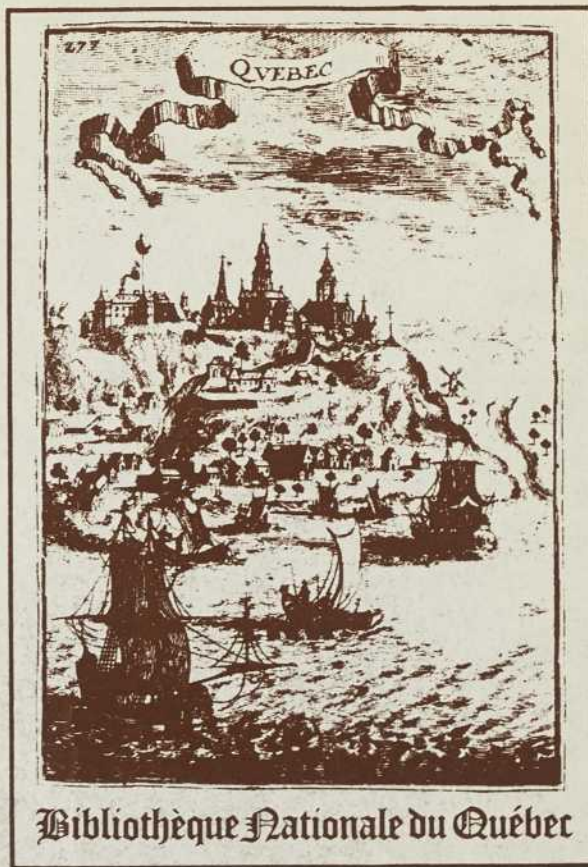
Bibliothèque Nationale du Québec