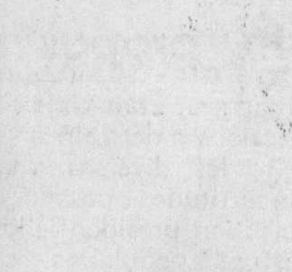
Partie de Bridge... Concentration... silence... jeu sérieux... des quantités de cigarettes! C'est bien alors que vous avez besoin de ce bon goût frais et pur de Spud pour faire le bonheur de votre bouche.