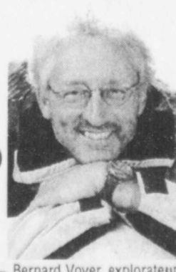
Bernard Voyer, explorateur

Opération Bonne Mine (S.A.J.E.) 2225, rue Henri-Bourassa Québec (Québec) J1J 3X1