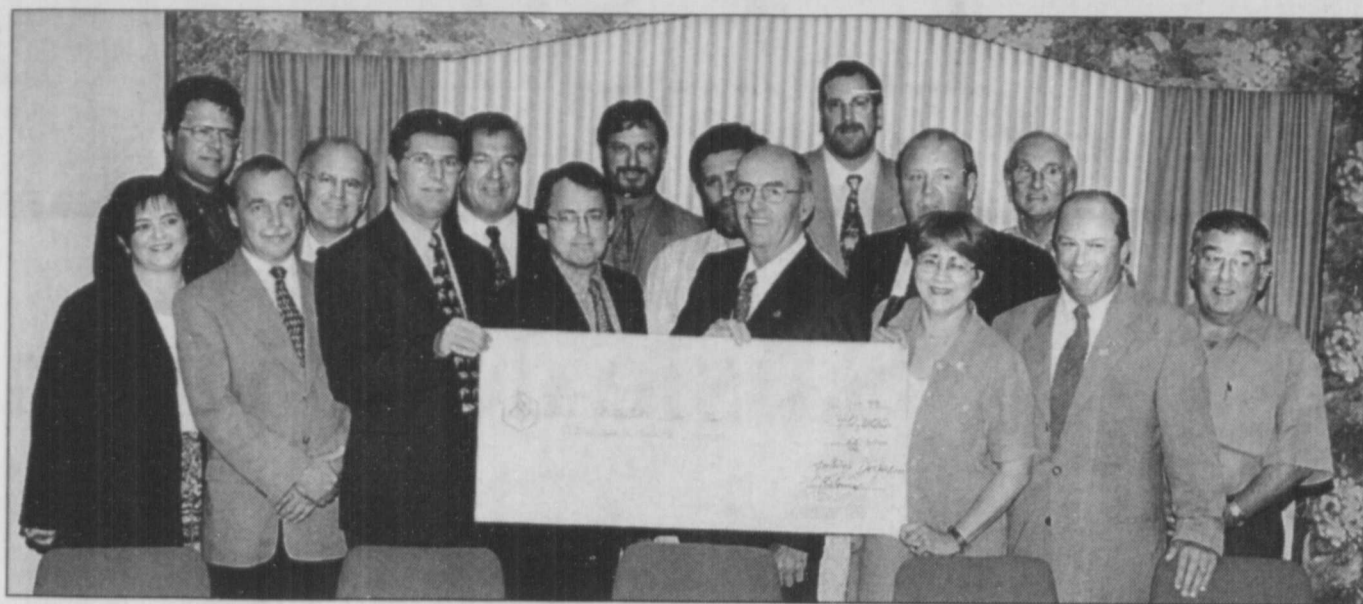
Le don des neuf caisses populaires complète à peu près la campagne de financement de la Fondation du CHBC.