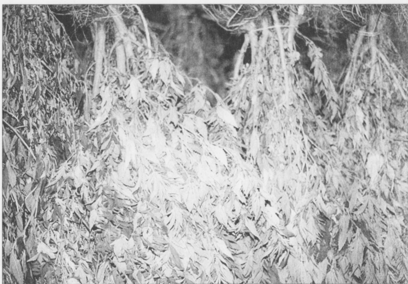
Les 285 plants étaient dissimulés dans une baie du lac Blanc.

C'est une information anonyme qui a conduit les policiers à faire cette découverte. Une enquête de trois semaines a permis de mettre la main au collet du jardinier en herbe directement sur place. Il s'agit de la plus importante saisie du genre cette année sur la Côte-Nord.