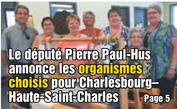
Le député Pierre Paul-Hus annonce les organismes choisis pour Charlesbourg-Haute-Saint-Charles