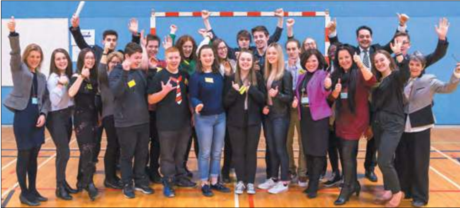
Une partie des jeunes qui ont participé à cette journée spéciale le 23 février dernier à l'école secondaire de Neufchâtel.

(MS) Dans le cadre du Forum jeunesse de la Commission scolaire de la Capitale qui s'est déroulé le 23 février dernier au sein de l'école secondaire de Neufchâtel sous la thématique « Et si on voyait l'école autrement? », une centaine de jeunes en provenance de plusieurs écoles secondaires de la Commission scolaire de la Capitale se sont réunis pour discuter de leurs attentes et de leur vision de l'école de demain.