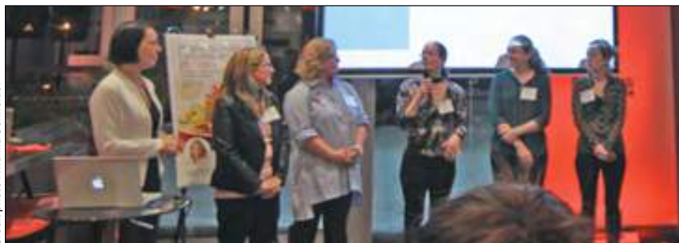
Plusieurs personnes ont pris la parole durant la soirée pour parler de leur expérience personnelle.