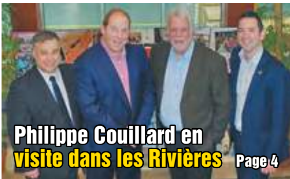
Philippe Couillard en visite dans les Rivières