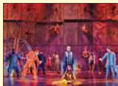
Le spectacle Notre Dame de Paris