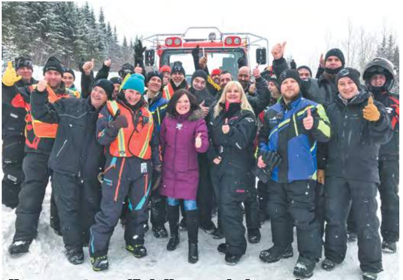
Une ouverture officielle sous la bonne humeur