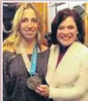
Laurie Blouin, médaillée d'argent aux Jeux Olympiques en slopestyle