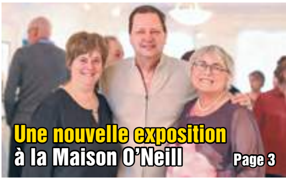
Une nouvelle exposition à la Maison O'Neill

Lundi ..... 8 h 30 à 16 h Mar. au jeu. .... 8 h 30 à 20 h Vendredi ..... 8 h 30 à 18 h Samedi ..... 9 h à 13 h