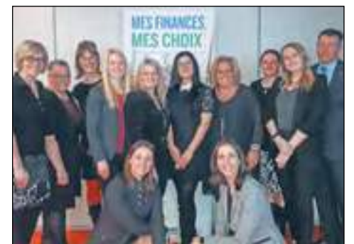
Les membres du comité d'éducation financière « Mes Finances Mes Choix MD »

La Caisse Desjardins Des Rivières de Québec offre gratuitement des ateliers de groupe dynamiques et interactifs d'une durée de deux heures chacun, aussi bien disponibles de jour que de soir. ■