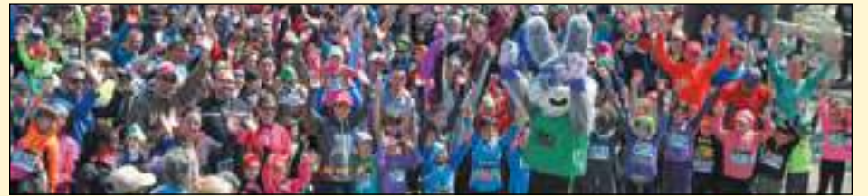
Les amateurs de course et les familles sont invités à participer au Défi des cocos le 31 mars prochain au parc du Père-Frédéric.

Selon les organisateurs, il s'agit d'un événement à ne pas manquer à l'approche du printemps et à l'occasion de la fin de semaine de Pâques. Les coureurs pourront profiter d'un stationnement gratuit à l'école secondaire La Camaradière. Durant la matinée, des collations seront distribuées à tous les coureurs au chapiteau principal (sur présentation du dossard seulement). Le tarif de la course s'élève à 15 $ pour ceux et celles qui souhaitent y participer. De nombreuses personnes sont attendues pour cette nouvelle édition.