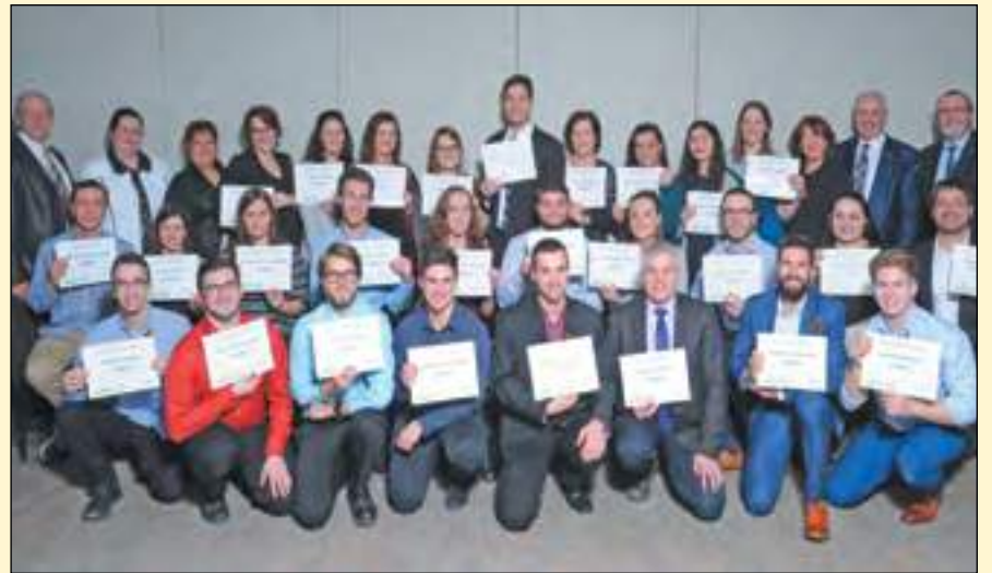
Les récipiendaires du programme de bourses 2017 de la Caisse Desjardins Des Rivières de Québec.

Le 11 décembre dernier, des bourses d'une valeur allant de 2 000 $ à 4 000 $ ont été remises afin d'appuyer les jeunes membres dans leurs études et leurs projets de vie de la part de la Caisse Desjardins Des Rivières de Québec. En effet, les jeunes sont une véritable priorité pour la Caisse. ■