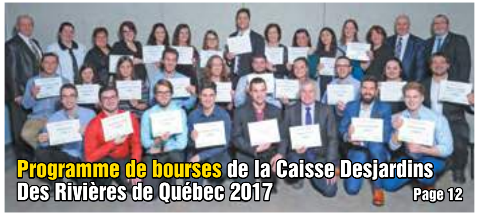
Programme de bourses de la Caisse Desjardins Des Rivières de Québec 2017