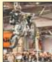
Le Salon de la Moto et du VTT 2018

Le Salon de la Moto et du VTT de Québec, présenté par La Capitale Assurances Générales, a rassemblé une dense foule à Exposité du 4 au 4 février dernier, malgré les caprices de Dame Nature qui a fait se déferler sur Québec une importante bordée de neige le dimanche. Ce sont plus de 18 000 visiteurs qui ont franchi les portes du Salon, prouvant ainsi leur amour indéfectible pour les bolides à deux roues! Cette année, bonne nouvelle, la majorité des visiteurs ont passé plus de temps sur le site du Salon que par les années passées, profitant ainsi amplement de la présentation des nouveaux modèles comme des activités et spectacles sur place.