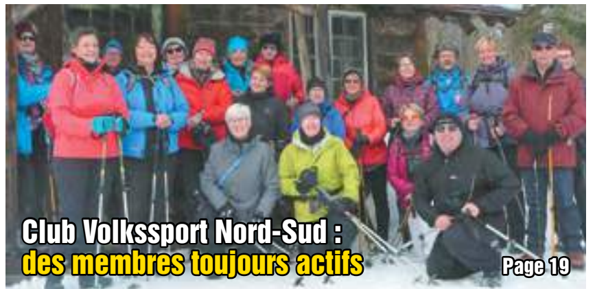
Club Volkssport Nord-Sud : des membres toujours actifs