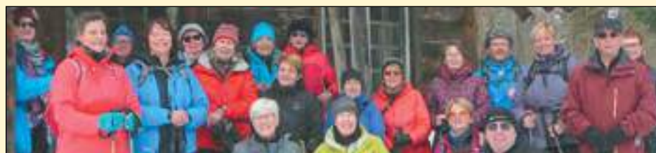
Les membres du Club Volkssport Nord-Sud lors de leur activité à Saint-Paulin dans les dernières semaines.

Lors des activités événements, le Club invite les membres à se présenter 30 à