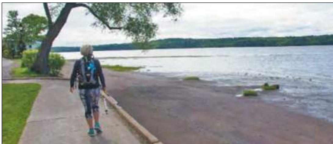
L'expérience du Chemin des Sanctuaires représente tout un dépaysement pour tout ceux qui y prennent part.