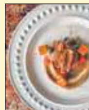
Les calmars confits du menu spécial 4 e anniversaire

Au cours des prochains mois, le meilleur, mais surtout l'unique, restaurant corse de la province, Petits Creux & Grands Crus, procédera, dans la foulée de son 4 e anniversaire, à un réaménagement de sa salle à manger afin de proposer à sa fidèle clientèle une expérience encore plus sensationnelle! Et autre bonne nouvelle : le bistrot de quartier, qui ouvre déjà sept soirs sur sept, sera dès avril également ouvert cinq midis par semaine, pour le plus grand plaisir des habitués du secteur qui s'y sentent comme chez eux! Également, Petits Creux & Grands Crus a le plaisir d'offrir depuis quelque temps à sa clientèle de rapporter à la maison les saveurs authentiques de la Corse grâce à la production et à la vente de tartinades sucrées et salées directement au restaurant.