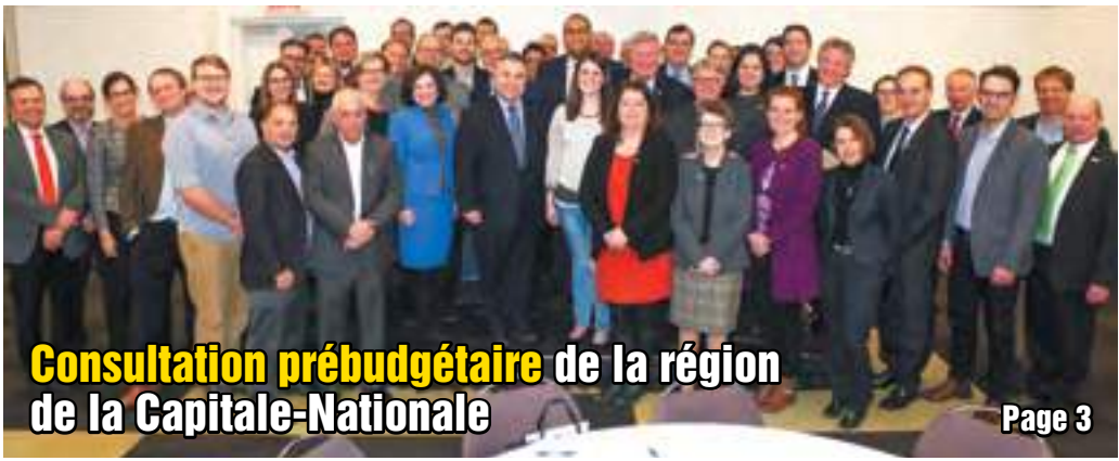
Consultation prébudgétaire de la région de la Capitale-Nationale