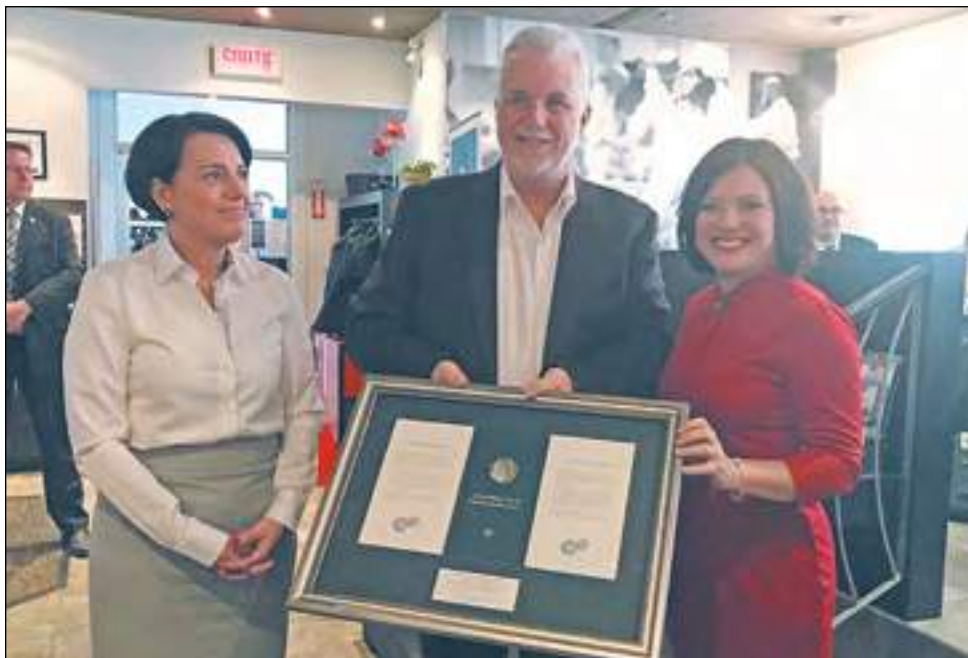
La députée de Chauveau en compagnie du premier ministre du Québec lors de l'un de ses déjeuners.

Des membres de la direction du Centre de la Famille Valcartier étaient aussi présents afin de remettre au premier ministre le « Coin » de la Famille pour sa contribution au succès de l'organisme. ■