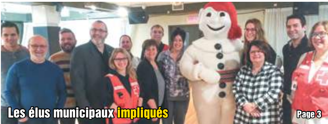
Les élus municipaux impliqués