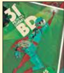
L'affiche du 31 e Festival Québec BD réalisée par l'auteur et illustrateur Paul Bordeleau