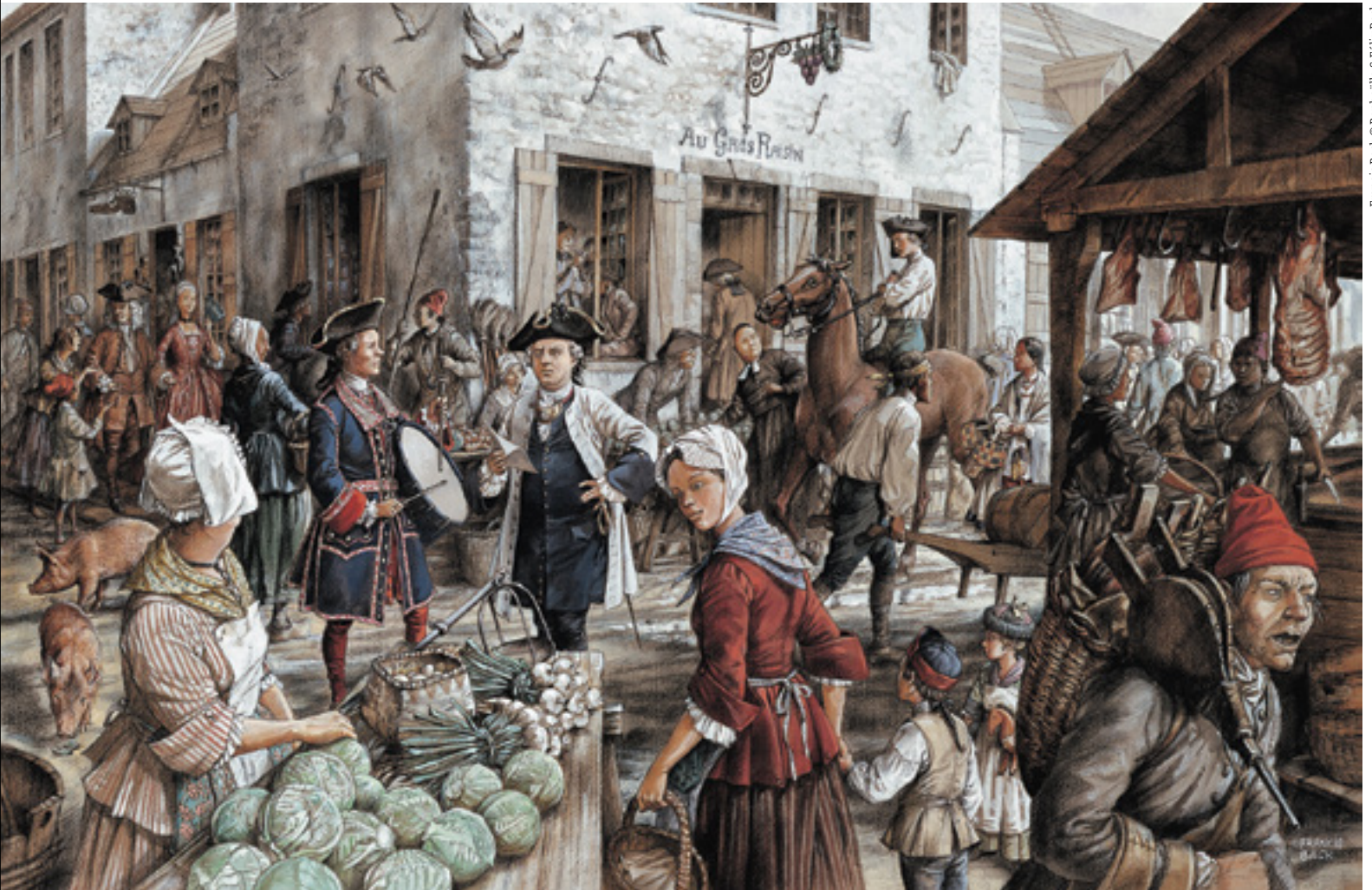
Francis Back © Raphaëlle & Félix Back

Là où s'élève l'édifice de l'Ancienne-Douane se trouvait, jadis, la première place du marché à Montréal. La vie citadine du 18 e siècle gravite autour de ce lieu où tous les mardis et jeudis matin la population se rend faire ses provisions. C'est aussi là que l'huissier fait la lecture des ordonnances royales et qu'on inflige les châtiments publics.