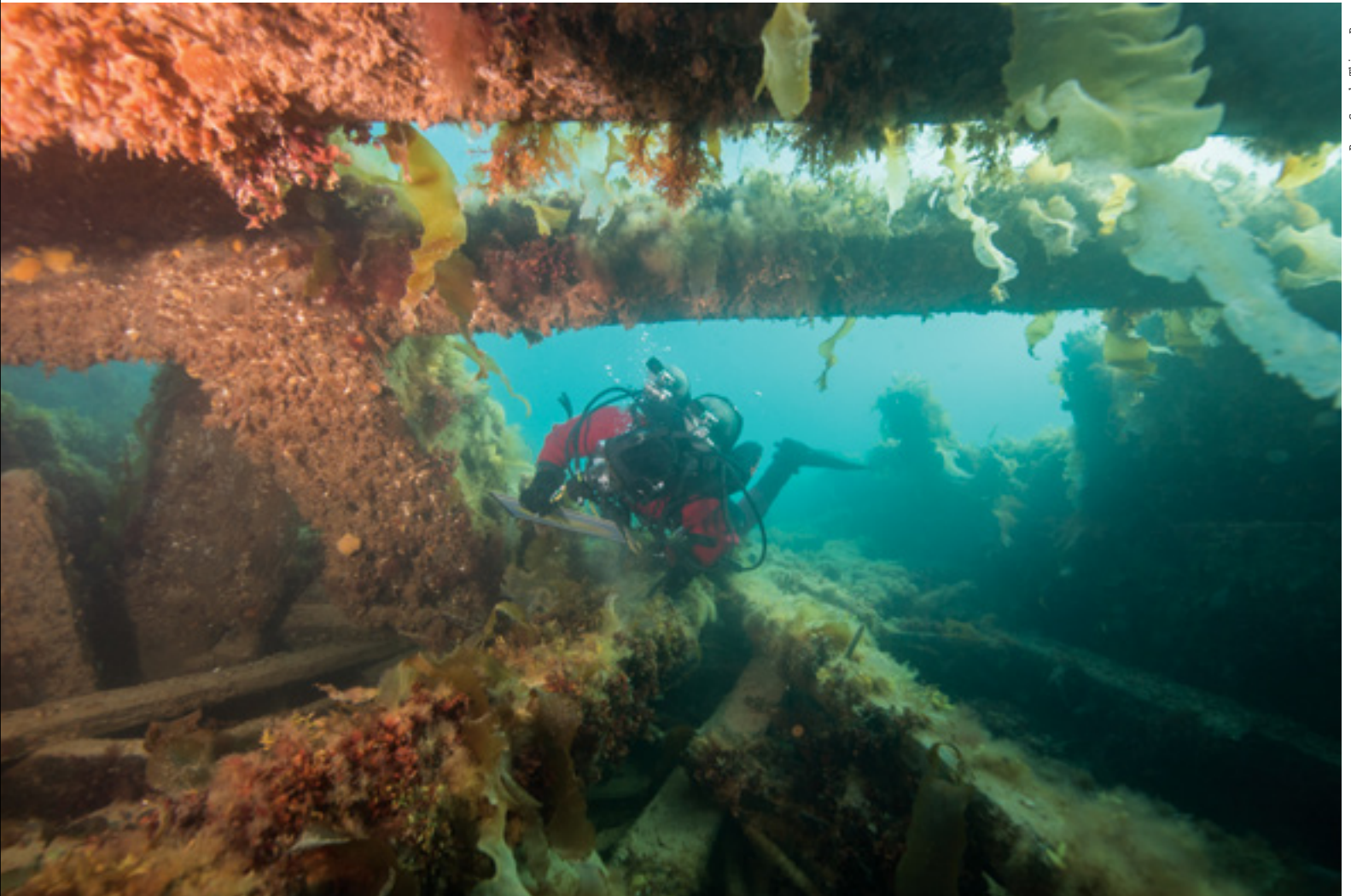
Parcs Canada, Thierry Boyer

Partout à travers le Québec, au fil du temps et de l'eau, on a endigué des rivières et des lacs pour rendre possible l'implantation de moulins hydrauliques et faire ainsi tourner l'économie. Dès le début du 20 e siècle, des territoires immenses ont même été ennoyés par d'immenses réservoirs afin de permettre la production d'hydroélectricité. À n'en pas douter, une partie de l'histoire humaine inscrite dans nos paysages nous échappe parce que... submergée. Mais dans quelle mesure? Difficile à dire. Prenons le cas du lac Saint-Jean. En 1926, la construction d'un barrage a entraîné une élévation de son niveau qui, sans que celui-ci dépasse de beaucoup ce qu'il était auparavant lors des crues printanières, s'est traduite au fil du temps par une érosion des rives et la dispersion de certaines traces archéologiques. Cela dit, les niveaux