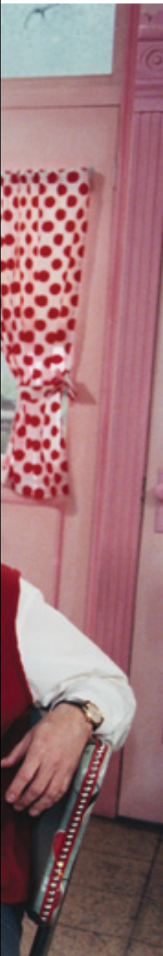
Michel Tremblay © Avanti Ciné Vidéo

Pour commémorer les 25 ans de la création de La Petite Vie , Pointe-à-Callière vous invite dans l'univers absurde de la famille Paré à compter du 5 décembre. Un rendez-vous pour tous ceux et celles qui ont encore en mémoire la série télévisée de 59 épisodes produite par Avanti Ciné Vidéo et présentée sur les ondes de Radio-Canada de 1993 à 1998, avec de nombreuses reprises depuis. En 1995, une des émissions atteint des cotes d'écoute à ce jour inégalées, avec plus de 4 millions de téléspectateurs. Aujourd'hui, La Petite Vie est devenue un véritable phénomène social. Entretien avec son auteur, alias Popa, Claude Meunier.