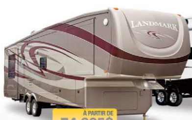
À PARTIR DE 74 995$ LANDMARK