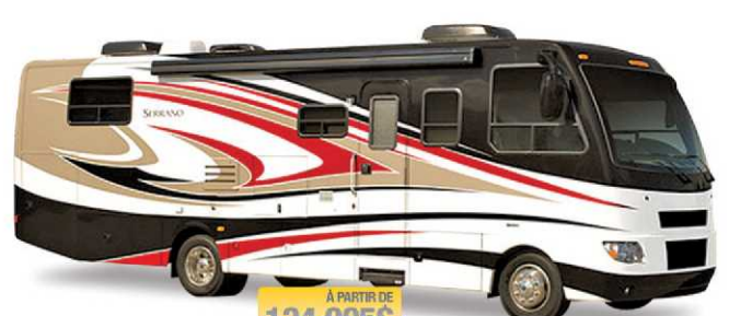
À PARTIR DE 124 995$ SERRANO