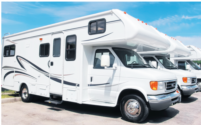
L'autocaravane de classe C comprend une couchette au-dessus de la cabine de pilotage.

Le nombre de personnes qui séjourneront à bord du VR est aussi déterminant dans le choix du modèle. De combien de lits aurez-vous besoin? Confort, intimité et espace de rangement sont autant de facteurs à considérer lors de votre achat. Souvenez-vous que vous ne ferez pas que dormir dans votre VR. Vous y prendrez aussi certains repas et y passerez beaucoup de temps, en particulier les jours de pluie.