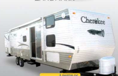
À PARTIR DE 23 995$ CHEROKEE