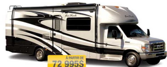
À PARTIR DE 72 995$ FOUR WINDS SIESTA