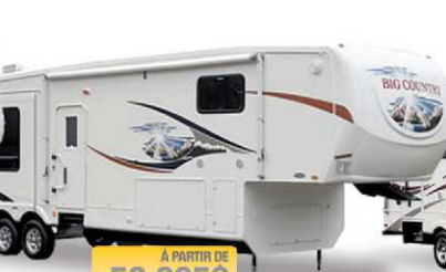
À PARTIR DE 52 995$ BIG COUNTRY