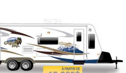
À PARTIR DE 15 995$ COBALT TRAIL