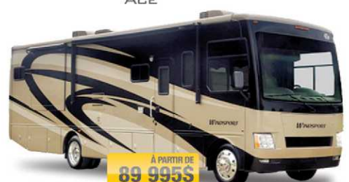
À PARTIR DE 89 995$ WINDSPORT