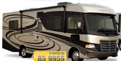
À PARTIR DE 85 995$ ACE