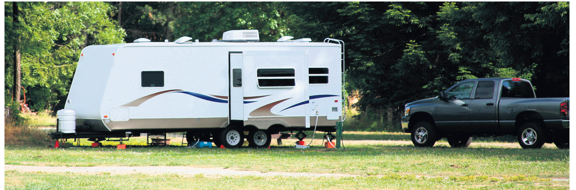
Certaines roulottes classiques de grandes dimensions sont dotées d'extensions qui se déploient pour offrir plus d'espace.

Si vous avez souvent besoin de vous déplacer lorsque vous séjournez sur un terrain de camping, vous préférerez sans doute le VR tracté à l'autocaravane. Avec certaines autocaravanes de classe A, il est cependant possible de tirer une voiture qui vous servira pour vos déplacements une fois à destination.