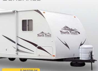
À PARTIR DE 19 895$ NORTH TRAIL