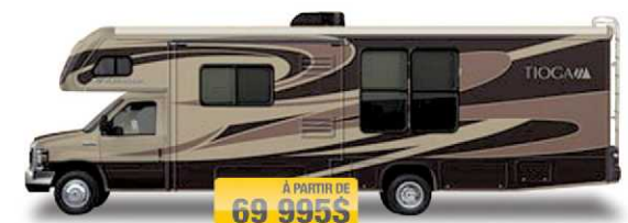
À PARTIR DE 69 995$ TIOGA RANGER