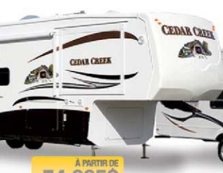
À PARTIR DE 74 995$ CEDAR CREEK