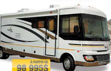
À PARTIR DE 98 995$ BOUNDER