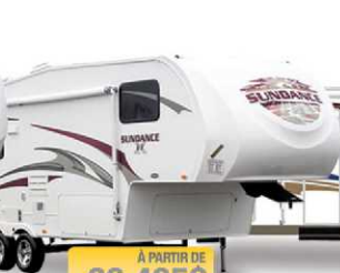
À PARTIR DE 26 495$ SUNDANCE