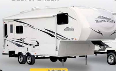
À PARTIR DE 23 995$ NORTH TRAIL