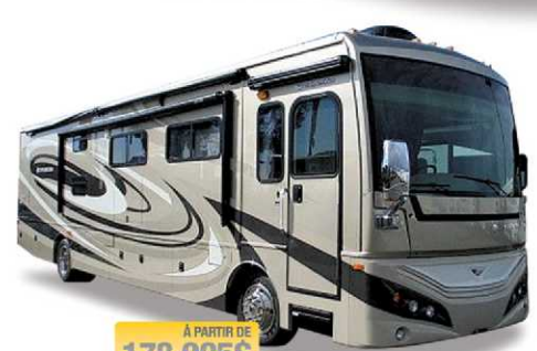
À PARTIR DE 178 995$ EXPEDITION