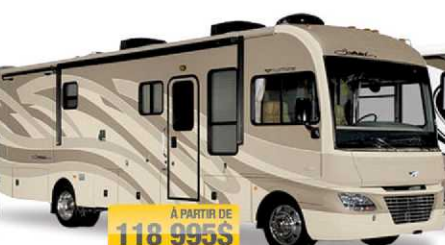
À PARTIR DE 118 995$ SOUTHWIND