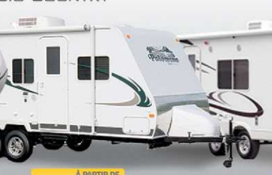
À PARTIR DE 18 995$ PALOMINO