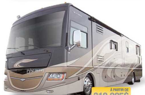
À PARTIR DE 219 995$ DISCOVERY