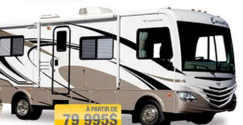
À PARTIR DE 79 995$ STORM