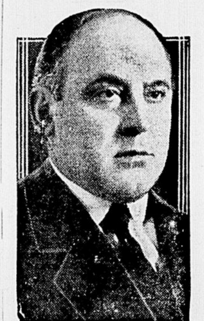
L'hon. T.-D. Bouchard, chef de l'opposition à l'Assemblée Législative, dont les innombrables amis viennent de célébrer le 57ème anniversaire de naissance.

M. Bouchard peut être appelé le fils de ses oeuvres, et nous nous plaignons tout particulièrement ici à rendre un juste témoignage d'estime et d'admiration à un confrère en journalisme qui a su faire sa marque par ses propres moyens, aidé en cela par une intelligence lucide et un allant peu ordinaire. Journaliste, il l'est jus-