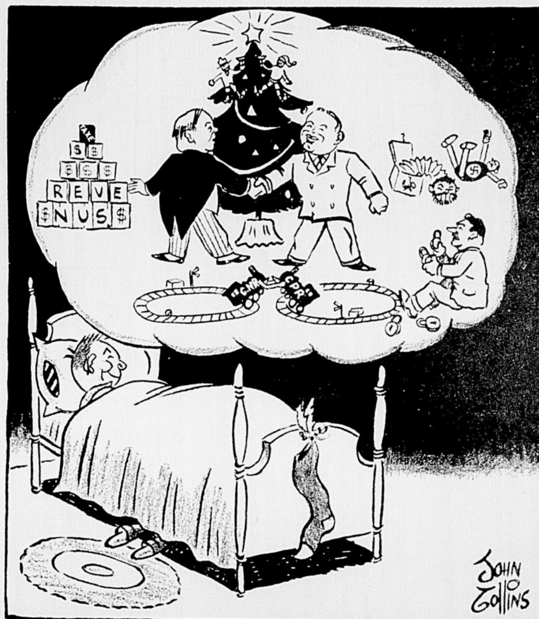
Le bon peuple "canayen" fait le beau rêve que MM. Mackenzie King et Hepburn se donnent la main pendant que M. Duplessis s'amuse avec quelques jouets.