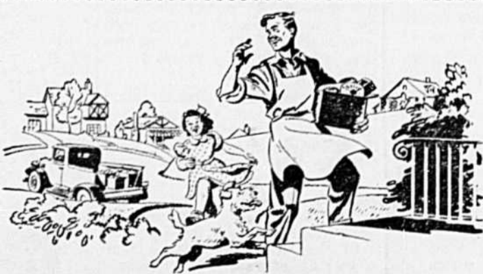
AVANT LA GUERRE: le jeune Jimmy Burke faisait la livraison des épiceries et il rêvait peut-être de posséder un jour son propre magasin.