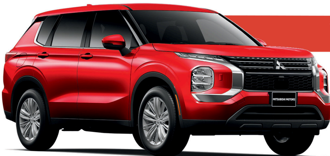
Outlander ES AWC 2024