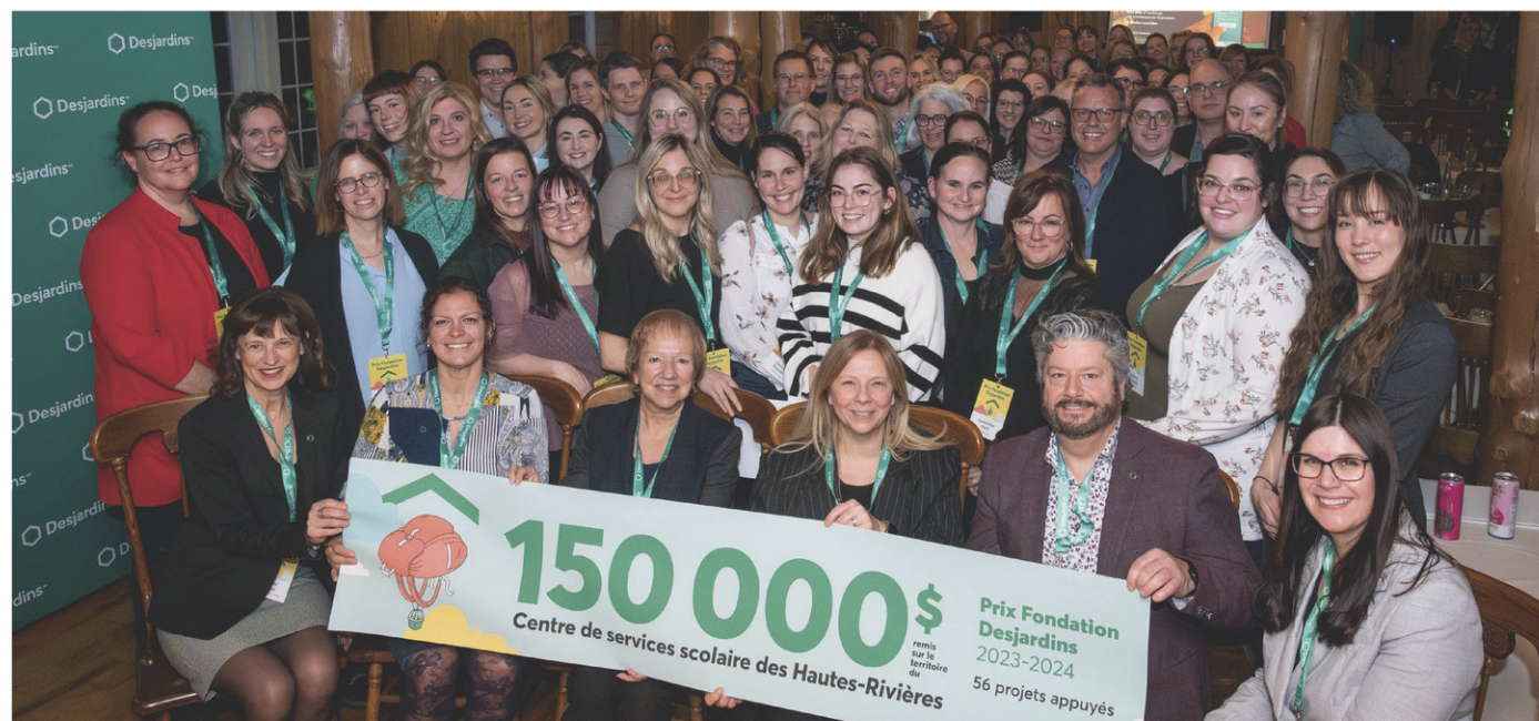
Plus de 150 000$ ont été remis par Desjardins pour des projets du domaine scolaire dans le territoire desservi par le Centre de services scolaire des Hautes-Rivières.

Un total de 77 400$ en bourses a été décerné à 29 projets d'enseignants et intervenants d'écoles primaires et secondaires du Haut-Richelieu. Parmi ceux-ci, il y a la création de ludothèques afin que les élèves bénéficient de matériel qui est adapté à leurs besoins et qui favorise le développement physique et sensoriel. D'autres projets mettent en valeur la nature et les activités extérieures, comme la