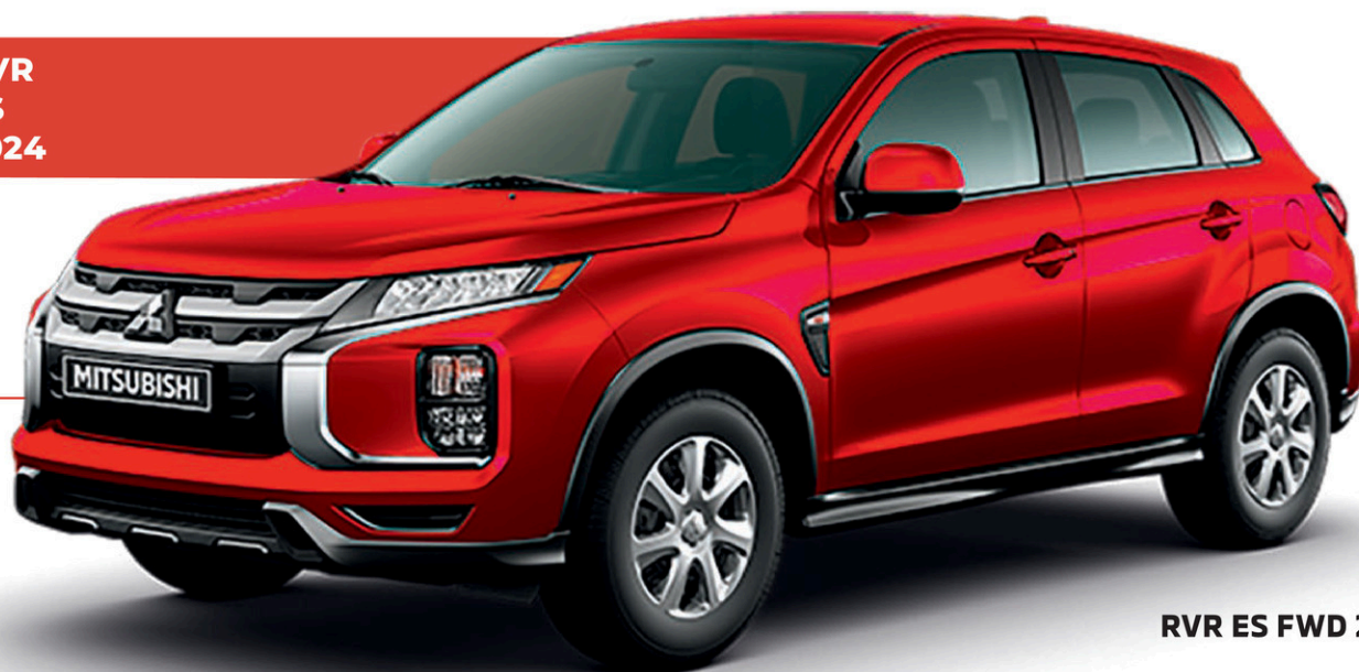
RVR ES FWD 2024