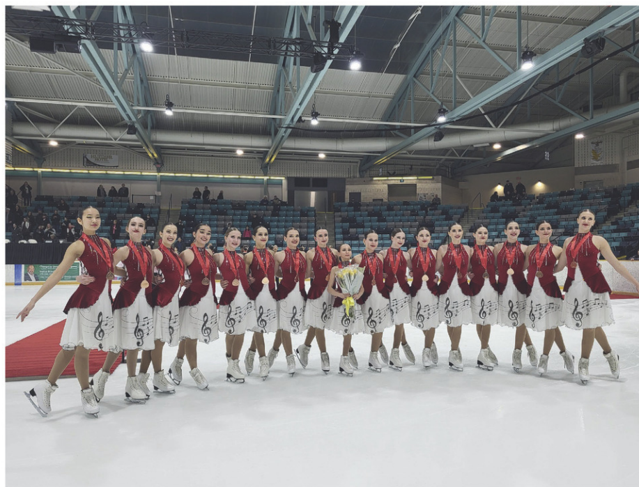
L'équipe de patinage synchronisé Nova lors des Championnats canadiens.

La soirée de poker au profit du club BMX Haut-Richelieu a attiré une quarantaine de personnes, le 24 février dernier, au pavillon Mille-Roches à Iberville. L'activité de financement a permis d'amasser 1500$. Cette somme sera versée au fonds des athlètes du club afin de diminuer les frais de participation à différentes compétitions.