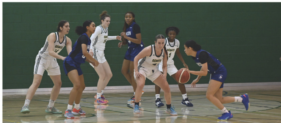
Les Géants participeront au Championnat canadien de basketball féminin pour une deuxième année de suite.