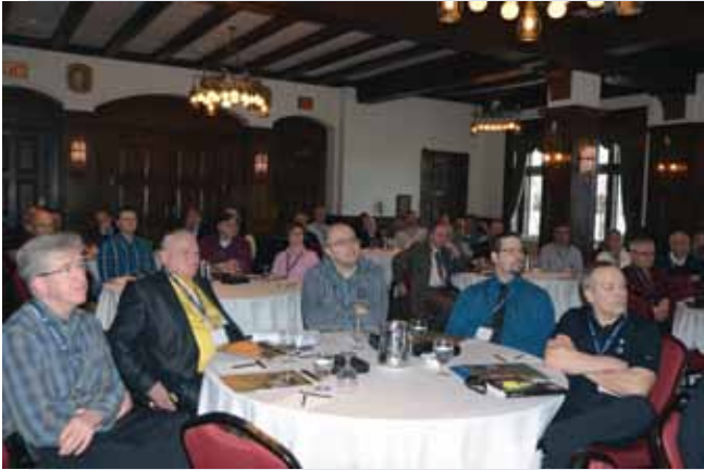
Vue d'ensemble de la salle