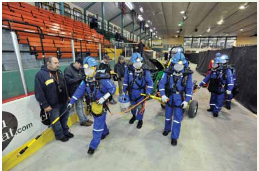
Les équipes de la mine Casa Berardi et du projet Westwood durant la compétition