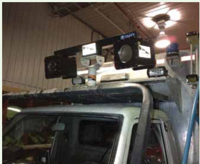
La caméra active Visi+ est installée sur les véhicules de sauvetage du site minier Raglan.