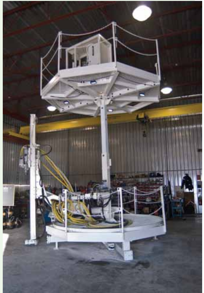
La plateforme de forage créée par l'entreprise Groupe minier CMAC-Thyssen.