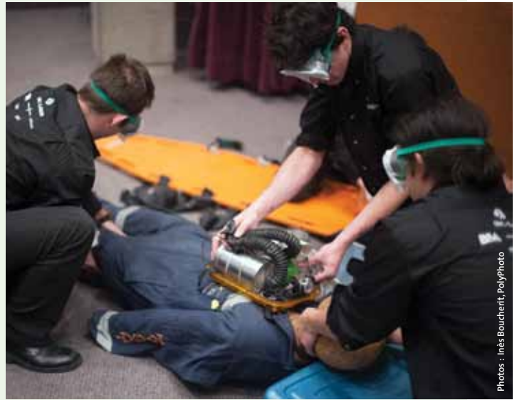
Une équipe d'étudiants lors de l'épreuve de sauvetage minier