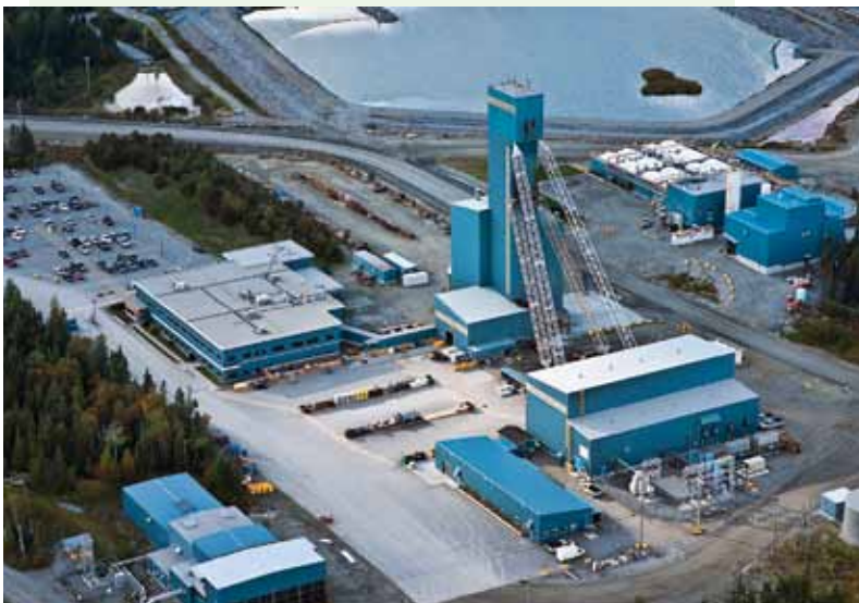
Vue aérienne de la mine LaRonde

De nos jours, de plus en plus de moyens de prévention sont mis en place pour augmenter la sécurité des gens et améliorer leur santé dans les mines souterraines. Un travail dans ce sens est fait par les entreprises minières, en collaboration avec les inspecteurs de la CSST, pour prévenir les accidents et diminuer leur nombre. • Fatou Diouf