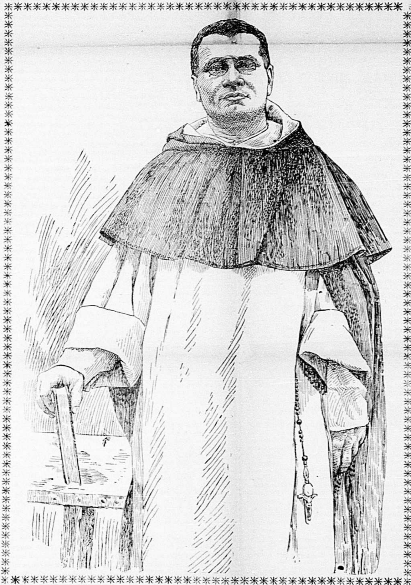
Le Révérend Père Hébert, Dominicain, prédicateur du Carême à Notre-Dame de Montréal.

Les nouveaux rédacteurs du "Nord" disent qu'ils veulent se battre pour la cause des écoles. C'est d'une belle crânerie, en effet, mais