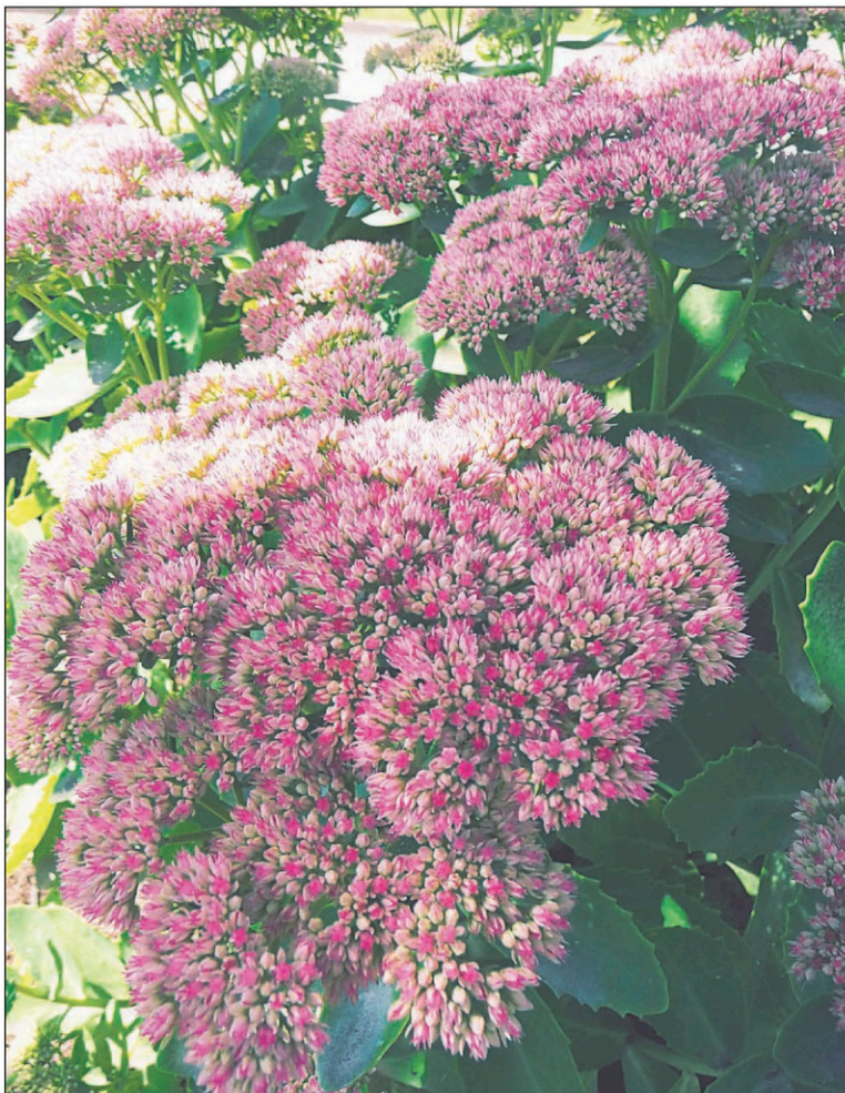
COLLABORATION SPÉCIALE, MÉLANIE GRÉGOIRE

Voici ce que j'ai rebaptisé les brocolis fleuris! Vous admettez quand même que l'appellation est bonne, car la ressemblance est frappante! Les fleurs sont habituellement roses, mais pour le feuillage, vous avez le choix entre le vert ou le pourpre. Par contre, je trouve que la variété à feuillage vert, le sedum «Autumn Joy», est plus robuste et que les fleurs se tiennent mieux. Si vous préférez tout de même le feuillage pourpre, optez pour la variété «Matrona», c'est, selon moi, la meilleure variété aux feuilles colorées. Excessivement facile d'entretien, le sedum atteint environ 60 cm de haut et préfère le plein soleil.