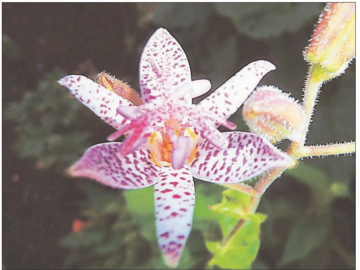
COLLABORATION SPÉCIALE, MÉLANIE GRÉGOIRE

Les fleurs du sedum sont habituellement roses, mais pour le feuillage, vous avez le choix entre le vert ou le pourpre.