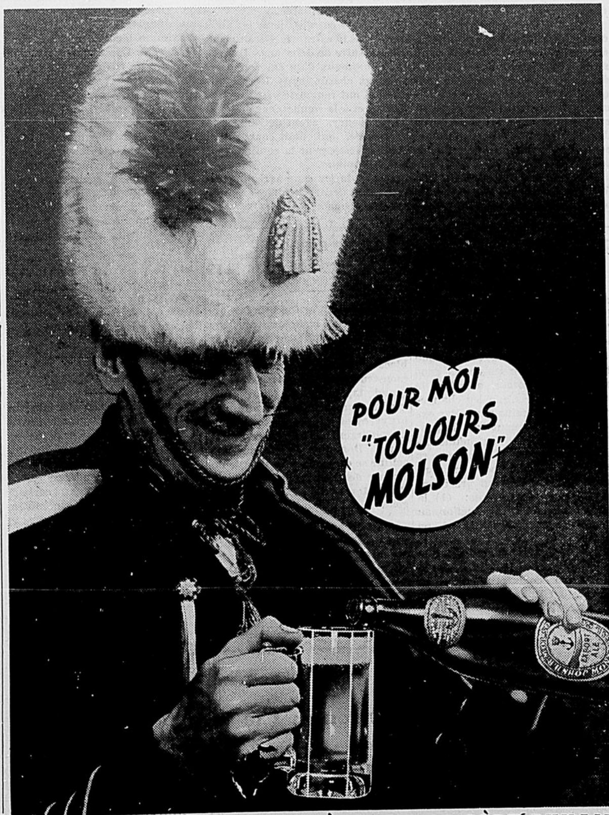
LA BIÈRE QUE VOTRE ARRIÈRE GRAND-PÈRE BUVAIT