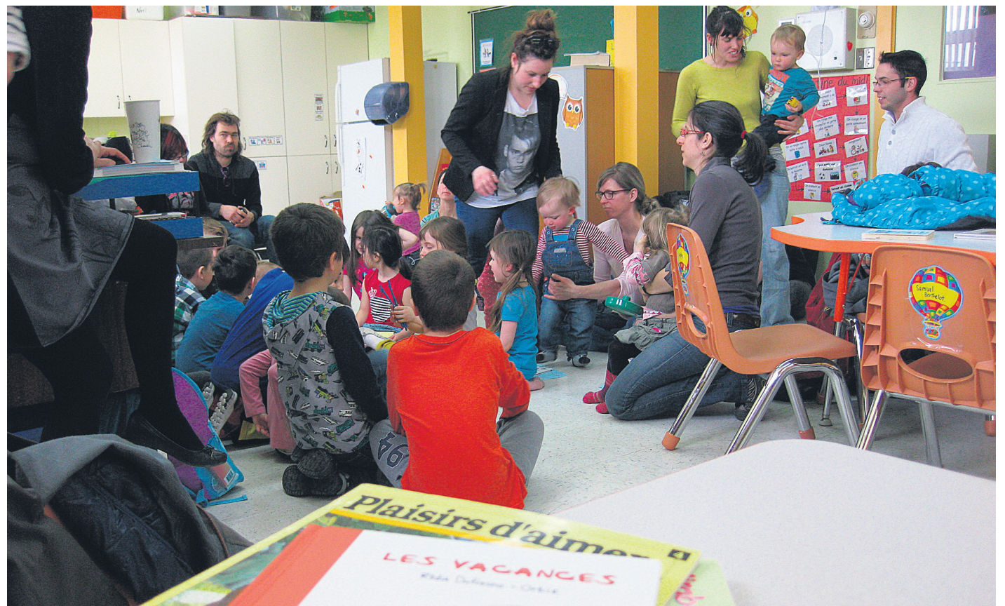
Cette expérience a tellement bien fonctionné qu'elle sera reprise au cours des prochains mois.