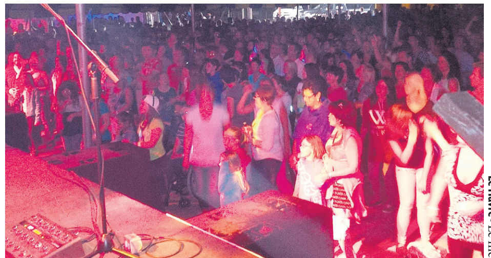
Le Festival est de plus en plus populaire à chaque année.