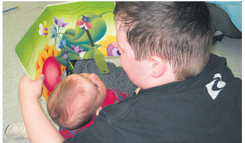
Une très belle expérience pour les petits.

À la suite du succès de cette première activité de lecture, l'école compte bien répéter l'expérience. Un nouveau jumelage est déjà prévu en juin. La direction souhaite également renouveler l'initiative l'an prochain. Les jeunes du primaire iront prochainement lire pour des personnes âgées.