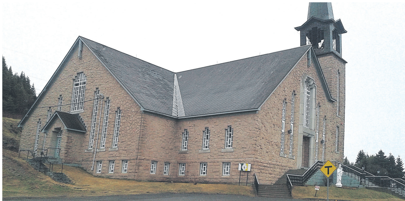
Selon le curé DeBlois, tout le monde doit se rallier derrière ce projet de rénovation de l'église de la paroisse.

Malgré l'achalandage en baisse, le curé croit qu'il est possible de réaliser ces rénovations. Il donne l'exemple de la paroisse de Gascons, qui, il y a une bonne dizaine d'années, a rencontré le même problème. « Les paroissiens se sont pris en main, ils ont fait beaucoup d'activités et