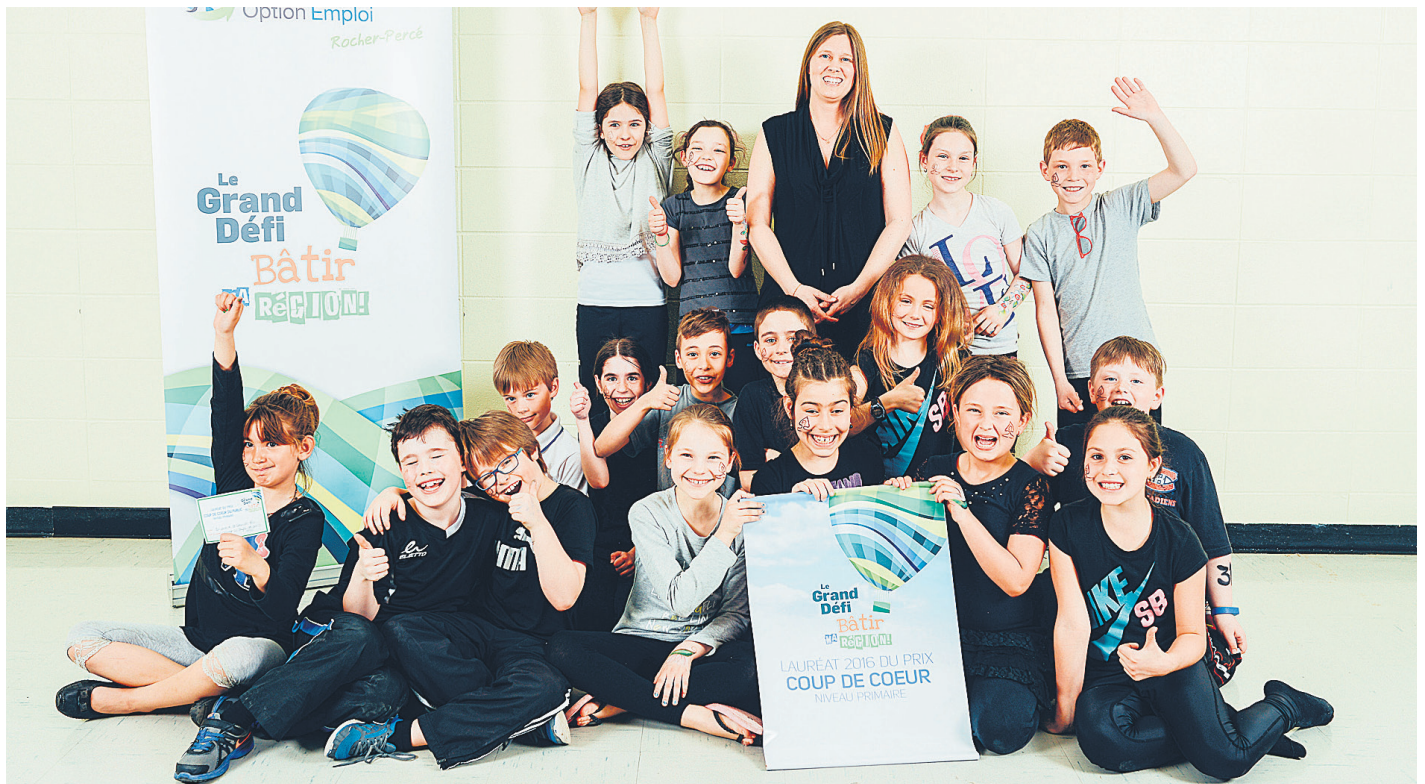
Les gagnants ont remporté au total plus de 20 000 $ en prix.

Carrefours jeunesse-emploi MRC La Côte-de-Gaspé, Avignon-Bonaventure et des Îles, ainsi que le Carrefour Jeunesse Option Emploi Rocher-Percé. Supporté par les Commissions scolaires René-Lévesque et des Chic-Chocs, il est aussi appuyé des partenaires majeurs suivants : les Caisses populaires Desjardins du Littoral et du Centre-sud gaspésien, le Collectif action-jeunesse Rocher-Percé, la Coopérative de développement régional Gaspésie-Les Îles, le Défi de l'entrepreneuriat jeunesse, la Fondation pour l'éducation à la coopération et à la mutualité, H&R Block, le ministère de l'Économie, de la Science et de l'Innovation, les MRC d'Avignon, de Bonaventure et du Rocher-Percé, Navigue.com, les Sociétés d'aide au développement de la collectivité (SADC) de Baie-des-Chaleurs et Rocher-Percé et la Table d'action en entrepreneuriat Gaspésie-Îles-de-la-Madeleine. (A.L.)