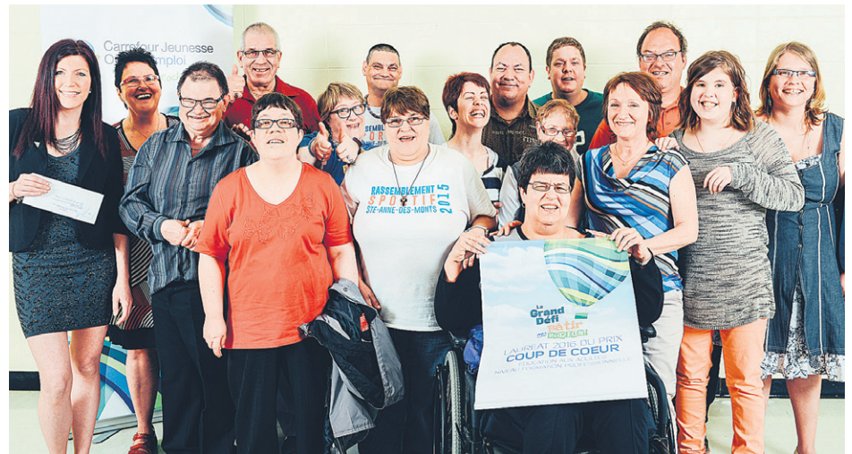
Pour cette édition, plus de 60 projets avaient été présentés par plus de 250 étudiantes et étudiants.

Carrefours jeunesse-emploi MRC La Côte-de-Gaspé, Avignon-Bonaventure et des Îles, ainsi que le Carrefour Jeunesse Option Emploi Rocher-Percé. Supporté par les Commissions scolaires René-Lévesque et des Chic-Chocs, il est aussi appuyé des partenaires majeurs suivants : les Caisses populaires Desjardins du Littoral et du Centre-sud gaspésien, le Collectif action-jeunesse Rocher-Percé, la Coopérative de développement régional Gaspésie-Les Îles, le Défi de l'entrepreneuriat jeunesse, la Fondation pour l'éducation à la coopération et à la mutualité, H&R Block, le ministère de l'Économie, de la Science et de l'Innovation, les MRC d'Avignon, de Bonaventure et du Rocher-Percé, Navigue.com, les Sociétés d'aide au développement de la collectivité (SADC) de Baie-des-Chaleurs et Rocher-Percé et la Table d'action en entrepreneuriat Gaspésie-Îles-de-la-Madeleine. (A.L.)