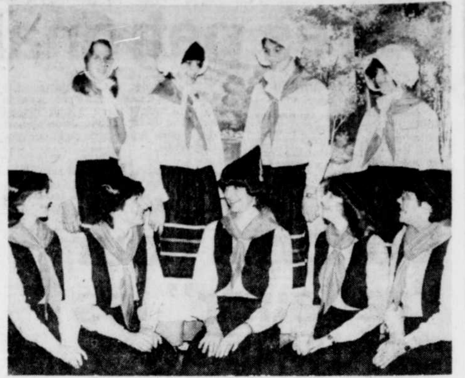
Quelques danseurs de la troupe "Les Petits Danseurs de Sainte-Marie" exhibent avec fierté leur traditionnel costume beauceron.

Autre fait important à souligner, il n'y aura pas d'enseignant mis en disponibilité pour la prochaine année scolaire. Il en sera de même pour le personnel cadre et celui de soutien.