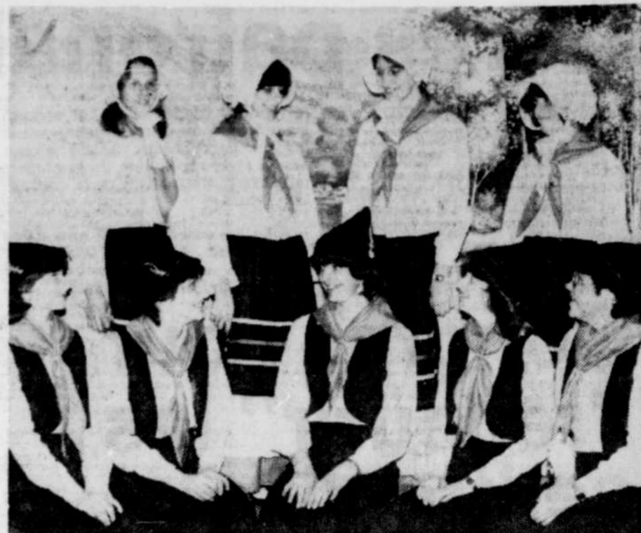
Quelques danseurs de la troupe "Les Petits Danseurs de Sainte-Marie" exhibent avec fierté leur traditionnel costume beauceron.

Autre fait important à souligner, il n'y aura pas d'enseignant mis en disponibilité pour la prochaine année scolaire. Il en sera de même pour le personnel cadre et celui de soutien.