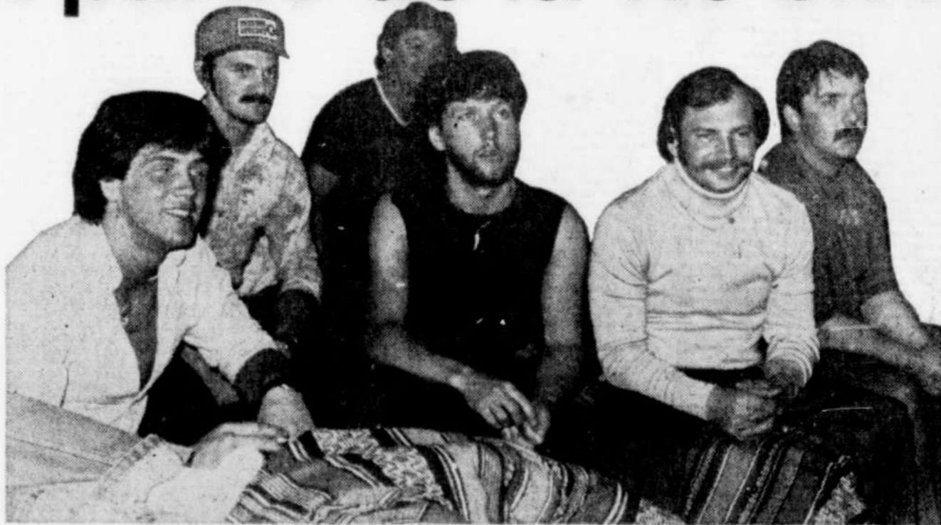
Les membres d'équipage du Roland-Desgagné étaient réunis dans un motel de la région de Pointe-au-Pic, hier.

"On a travaillé comme des forcenés pour installer les pompes et tenter de sauver le bateau. Dans ce temps-là, t'as pas conscience du