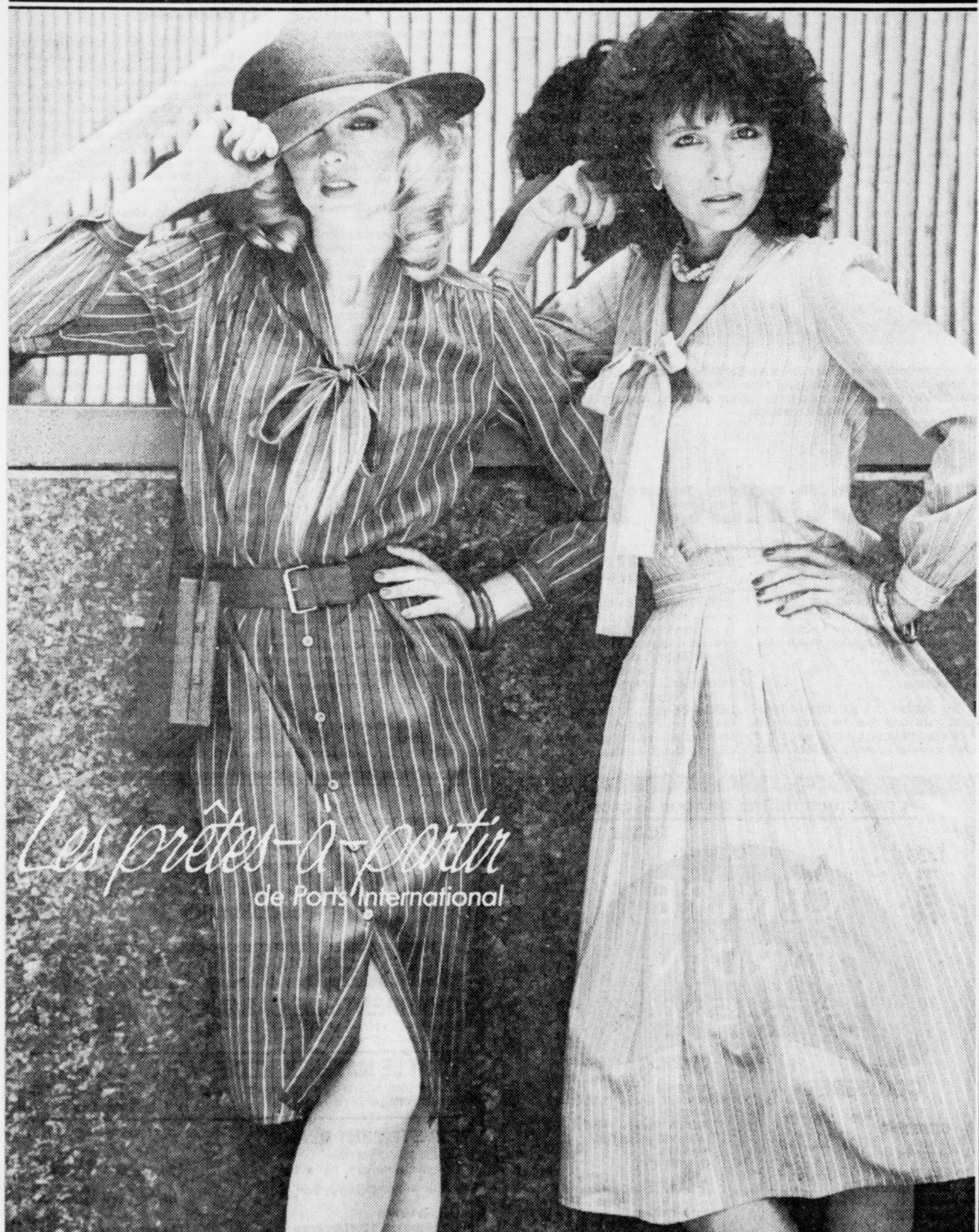
Les prêtées-à-partir de Ports International

que l'entente soit signée officiellement bientôt". Si brèche il y a, elle serait encore bien mince. Les travailleurs des deux principales usines (Newport avec environ 400 employés et Rivière-au-Renard, quelque 350) ne semblent pas donner de signes d'essoufflement.